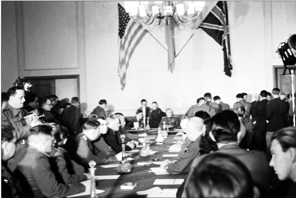
Зал під час церемонії підписання Акта про беззастережну капітуляцію. м. Берлін (Карлсхорст), 8 травня 1945 р.

З фондів ЦДКФФА України ім. Г. С. Пшеничного, од. обл. 0-231079