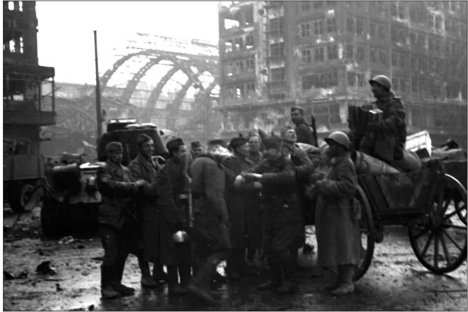
Радянські солдати святкують перемогу на одній з вулиць м. Берліна. 9 травня 1945 р. З фондів ЦДКФФА України ім. Г. С. Пиєничного, од. обл. 0-230915