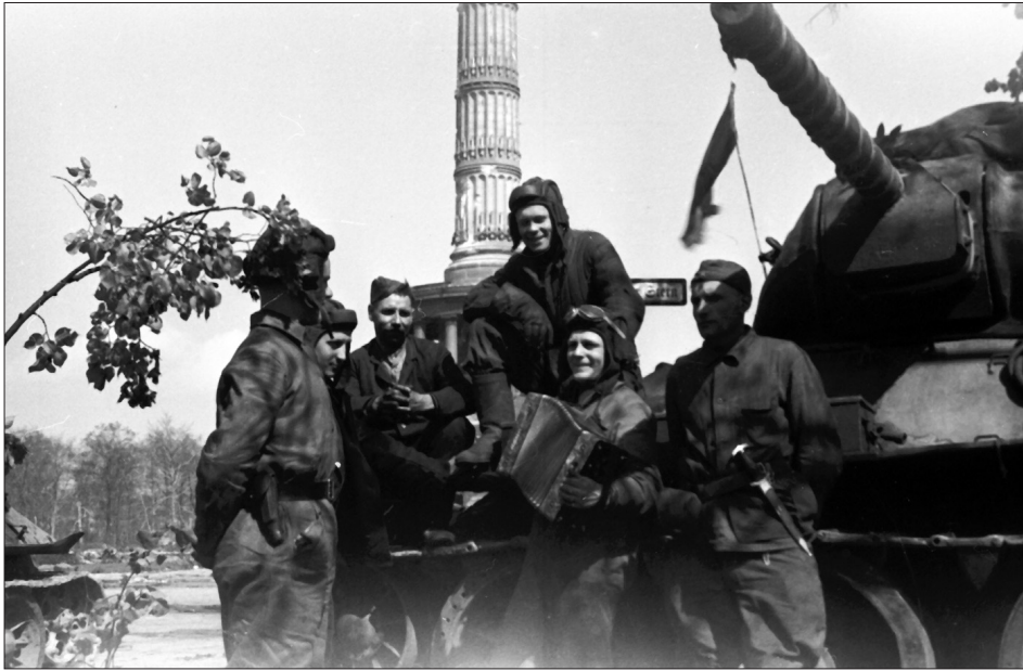
Екіпаж радянського танка Т-34 біля колони Перемоги в Тіргартенпарку в м. Берліні. 1 травня 1945 р. З фондів ЦДКФФА України ім. Г. С. Пшеничного, од. обл. 0-230854