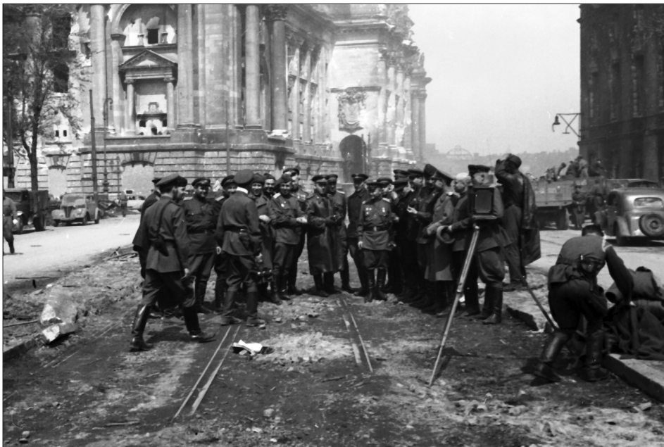
Радянські офіцери фотографуються біля стін рейхстагу в м. Берліні. 8–9 травня 1945 р. З фондів ЦДКФФА України ім. Г. С. Пшеничного, од. обл. 0-230911