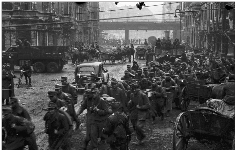
Німецькі військовополонені на вулиці м. Берліна. Травень 1945 р. З фондів ЦДКФФА України ім. Г. С. Пиєничного, од. обл. 0-230947