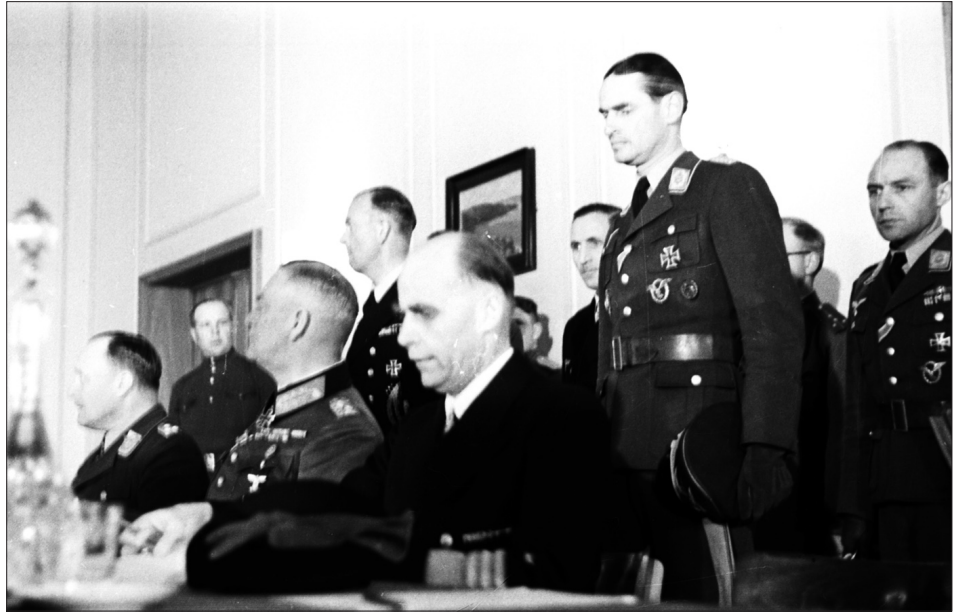
Делегація Німеччини в залі під час церемонії підписання Акта про беззастережну капітуляцію збройних сил Німеччини. Справа наліво (сидять) Г. Фрідебург, В. Кейтель та Г. Штумпф. м. Берлін (Карлсхорст), 8 травня 1945 р.