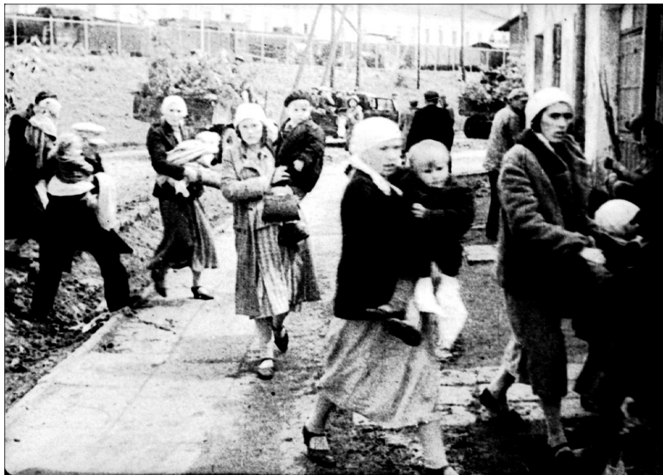
Жінки і діти на залізничному полотні під час евакуації. Україна, 1941 р.