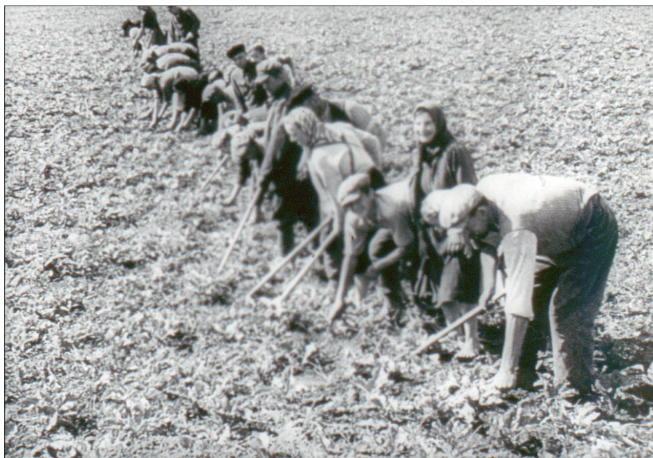
“Примусові робітники Третього Рейху” з України на сільськогосподарських роботах у Німеччині. 1943 р. З фондів ЦДКФФА України ім. Г. С. Пиленого, од. обл. 3264