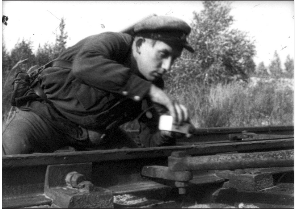
Боець партизанської дивізії ім. М. О. Щорса закладає вибухівку під залізничне полотно в районі ст. Олевськ. Житомирська обл., серпень, 1943 р.