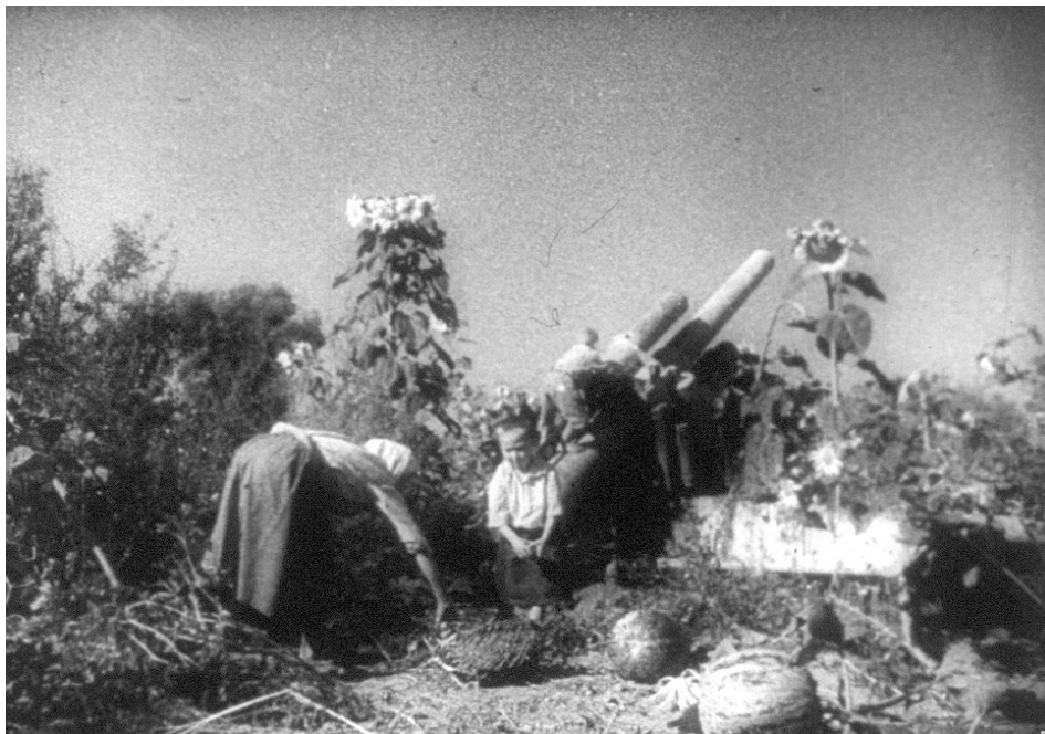
Ще вчора тут проходила лінія фронту. Україна, 1944 р. З фондів ЦДКФФА України ім. Г. С. Пшеничного, од. обл. 1536