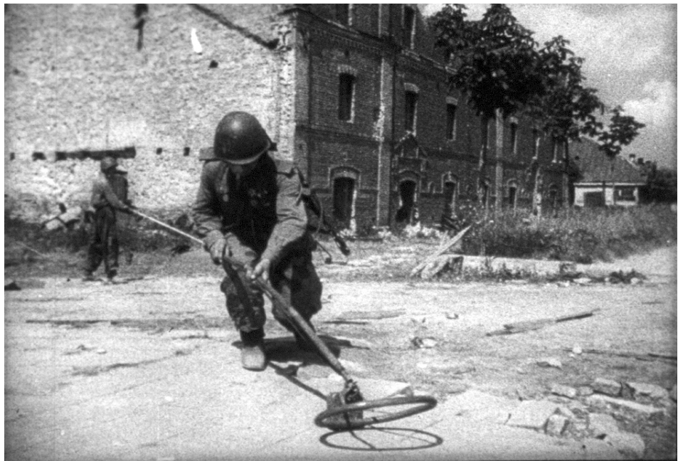
Розмінування вулиці в м. Ковель Волинської області. Серпень 1944 р. З фондів ЦДКФФА України ім. Г. С. Пиєничного, од. обл. 172