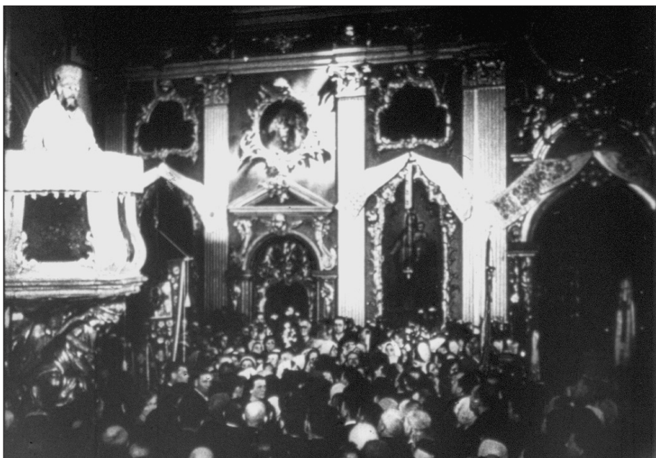
Великодня служба в Андріївській церкві за часів окупації. Київ, 1943 р. З фондів ЦДКФФА України ім. Г. С. Пшеничного, од. обл. 3275