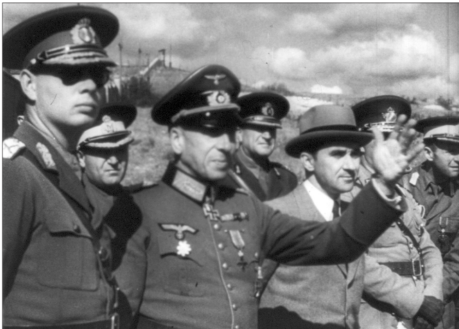
Відвідання Севастополя румунським королем Міхаєм I. 1942 р.