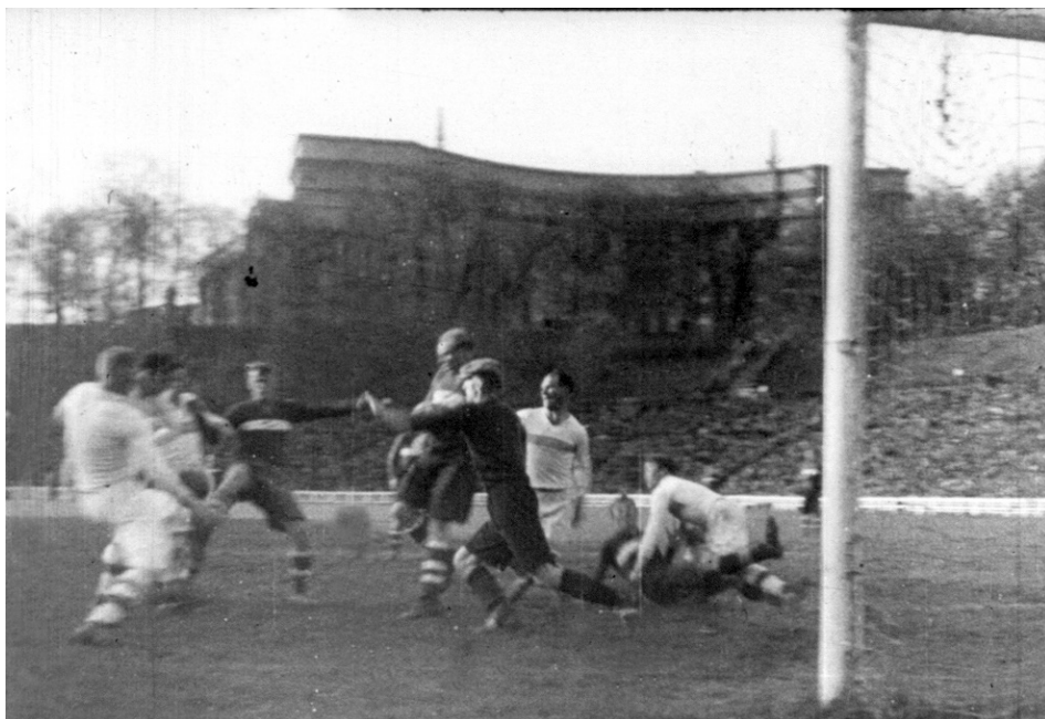
Один із моментів футбольного матчу між командами “Динамо” (Київ) і “Спартак” (Москва). Київ, 1944 р.