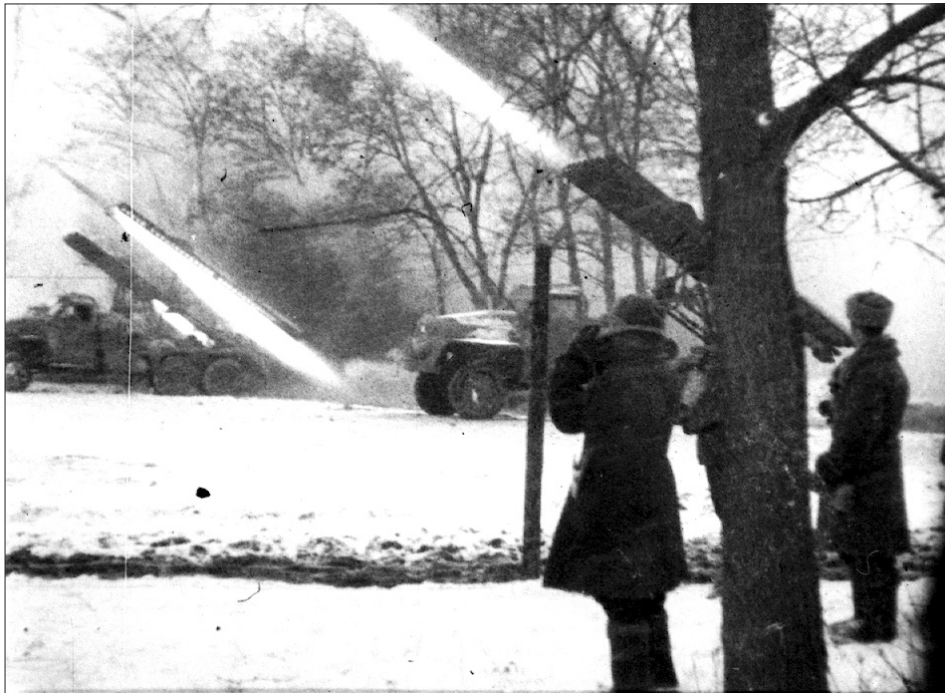
Гвардійські міномети ведуть вогонь в районі Корсунь-Шевченківського. Київська область, березень 1944 р. З фондів ЦДКФФА України ім. Г. С. Пиєничного, од. обл. 2055