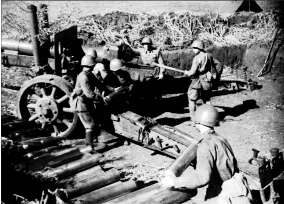
Радянські воїни під час боїв на о. Хортиця. Запоріжжя, серпень 1941 р.