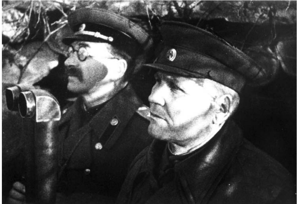
Командувачі 2-го Українського фронту І. С. Конев і 5-ї гвардійської танкової армії П. О. Ротмістров на спостережному пункті в районі м. П'ятихатки. Дніпропетровська область, 1943 р. З фондів ЦДКФФА України ім. Г. С. Пиєничного, од. обл. 592