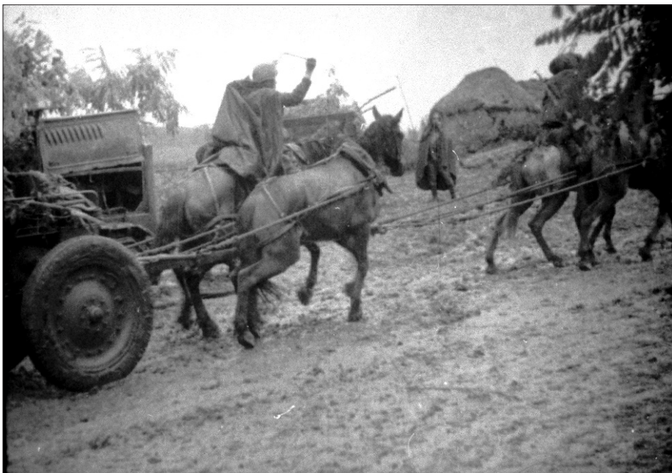
Відступ військ Червоної Армії. Україна, 1941 р.