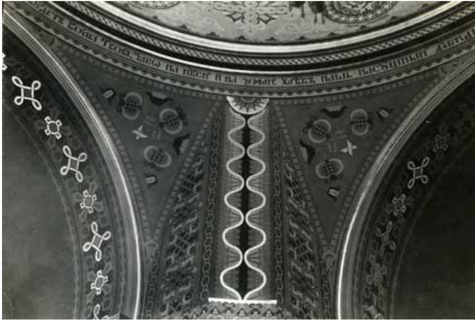
Фрагмент розпису іконостасу у Церкві Господнього Вознесіння в Нью-Йорку. Фотоальбом. 1952 р.

ЦДАМЛМ України, ф. 1366, оп. 1, стр. 65.