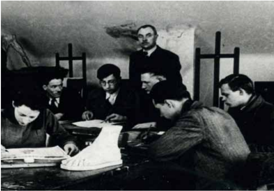
М. Бутович серед учнів малярської школи, 1940-і рр.

Книжкові ілюстрації Бутовича просякнуті національним колоритом та легкою народною іронією. Впродовж життя художник неодноразово повертався до ілюстрування “Енеїди” І.Котляревського. Його “Енеїда” – це перш за все народний гумор з деякими елементами та мотивами еллінізму, його герої насамперед поціновувачі радощів життя, а потім вже – вояки, образи яких з небожителів перетворені художником на запорізьких козаків. Малював обкладинки та ілюстрував “Вія”, “Старосвітських поміщиків” М. Гоголя, “Кладку видінь” Г. Діброва, “Брата твого Каїна” С. Ледяньського, “Проліски” Н. Щербини, окремі збірки 9 тощо.