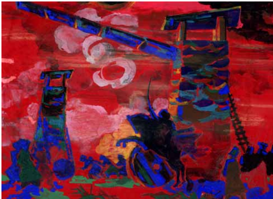
М. Бутович. Штурмові гуляй-городи. Картон, гуаш. 1954 р. ЦДАМЛМ України, ф. 1366, оп. 1, од. зб. 5, арк. 1.

Микола Григорович Бутович народився 1 грудня 1895 р. на Полтавщині, в с. Петрівка, в дворянській родині, яка вела свій родовід від заможної козацької старшини. Батьки-вчителі дали синові ґрунтовну освіту. Упродовж 1906–1913 рр. він навчався у Полтавському кадетському корпусі, а потім у військовій школі в Москві, і вже в той час почав поступово розкриватися його художній хист 2 .