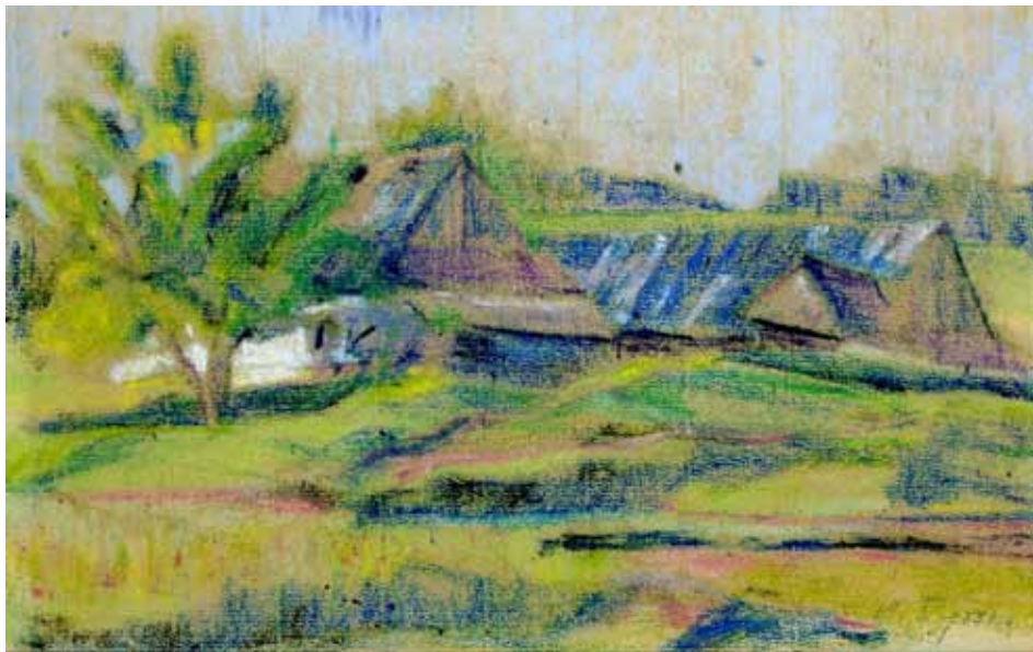
М. Бутович. Сільський пейзаж. Картон, пастель. 1946 р. ЦДАМЛМ України, ф. 1366, оп. 1, од. зб. 3, арк. 1

ростків української еміграції співучість мови та своєрідність культури залишеної Батьківщини. Ілюструючи книжки для емігрантських дитячих видань, він намагається побачити казковий світ очима дитини і в той же час розкрити глибинне значення відтворюваних явищ, тому тут і яскраве вбрання козачки, і жахливі часи татарської навали, і тремтлива краса казкової української хатинки, природи, образи дітей, косарів, драконів, русалок, коней, казкових героїв народних пісень, звірят 32 тощо.