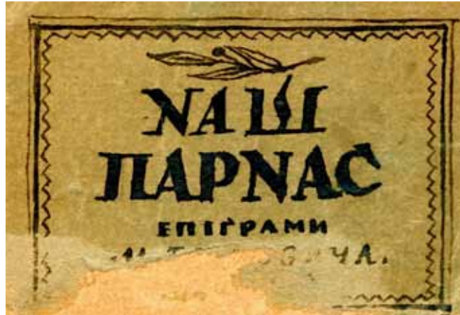
М. Бутович. “Наш Парнас”. Блокнот. Автограф. 1940–1950-і рр. ЦДАМЛМ України, ф. 1366, оп. 1, од. зб. 23.