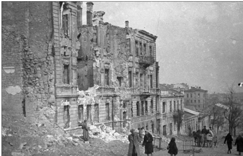
У звільненому місті. Фото Покатила М. Б. Державний архів міста Севастополя, фонд фотодокументів, од. зб. 0-15122.