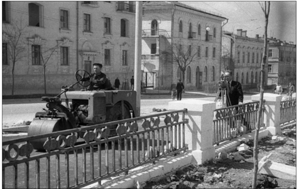
Асфальтування вулиці Леніна. Кінець 1940-х – початок 1950 рр.