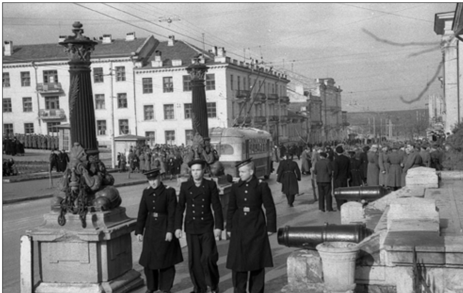
Вулиця Леніна. Кінець 1940-х – початок 1950-х рр.