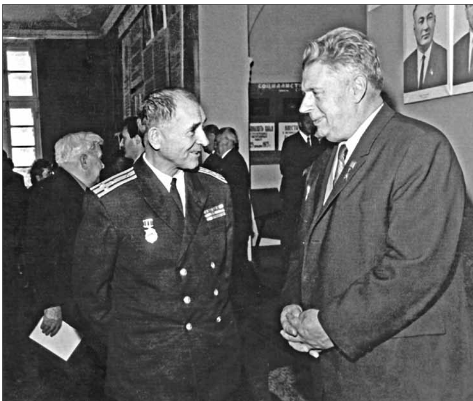
Герой Соціалістичної праці І. В. Комзін – колишній начальник Управління з відновлення Севастополя при Раді Міністрів СРСР. 1973 р. Державний архів міста Севастополя, ф. Р-567, оп. 4, спр. 54, арк. 4.