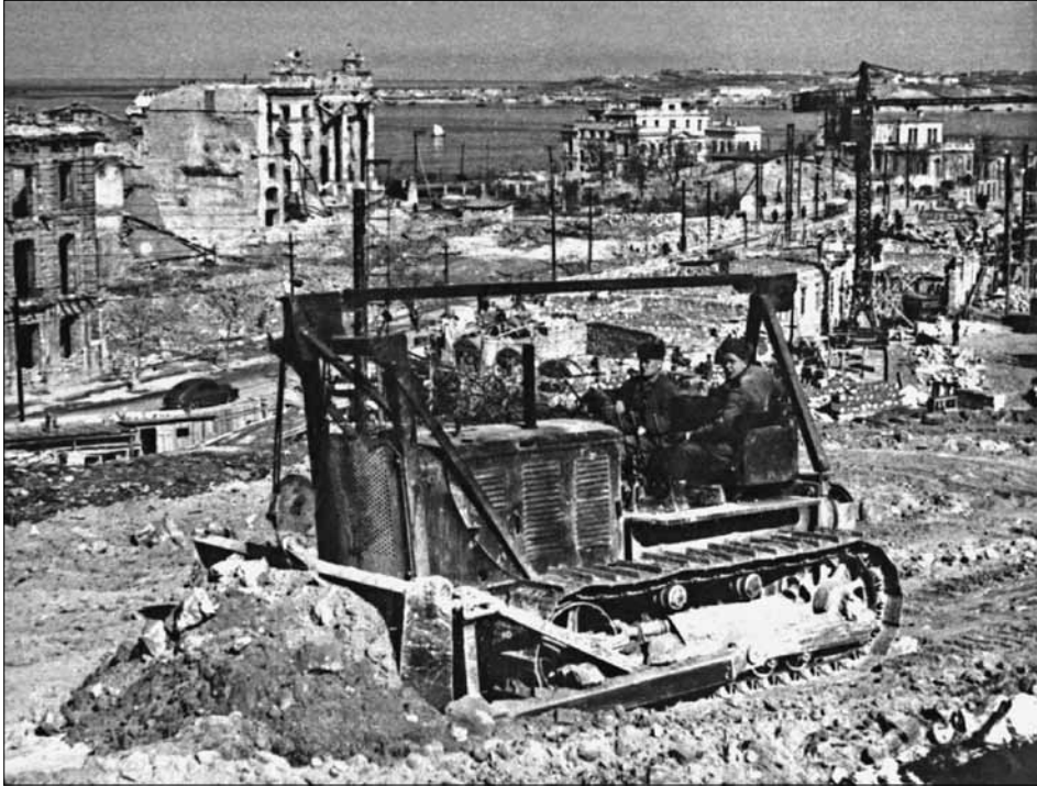
Забудова проспекту Нахімова. 1948–1949 рр.