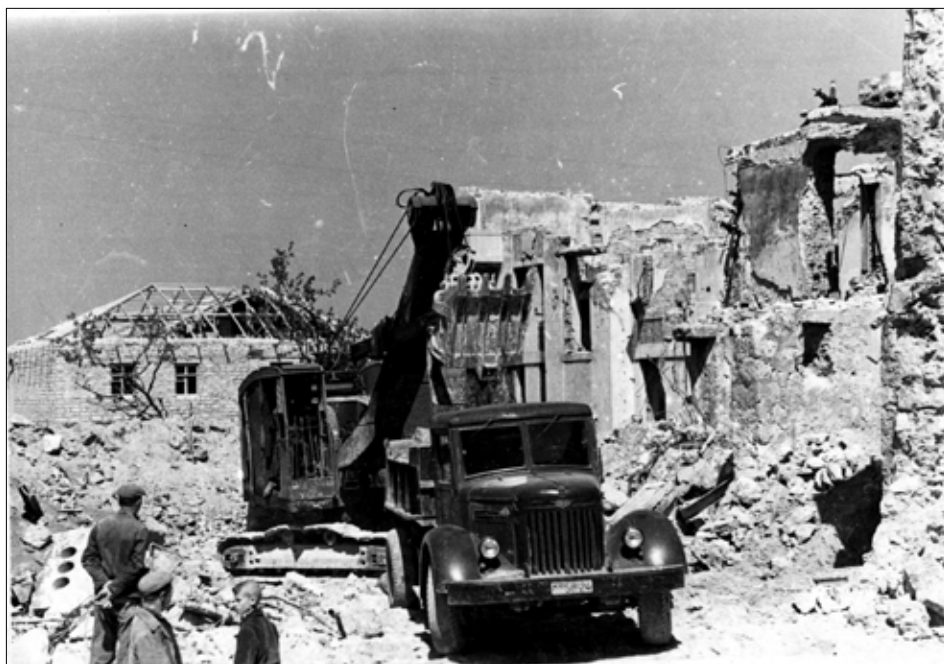
Знесення зруйнованих будівель на вулиці Леніна. 1952 р.