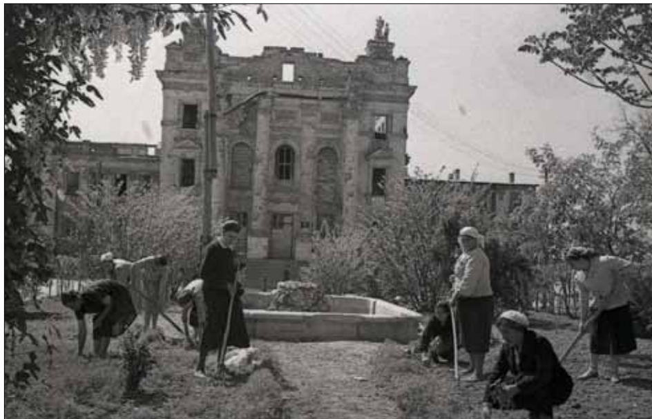
Черкасівська бригада за роботою. Друга пол. 1940-х рр. Фото Покагила М. Б. Державний архів міста Севастополя, фонд фотодокументів, од. зб. 0-14865.