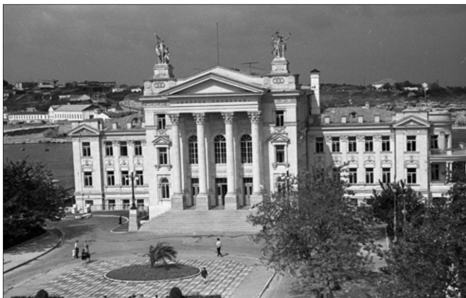
Палац піонерів. 1962 р. Фото Квітка Б. І. Державний архів міста Севастополя, фонд фотодокументів, од. зб. 0-51.