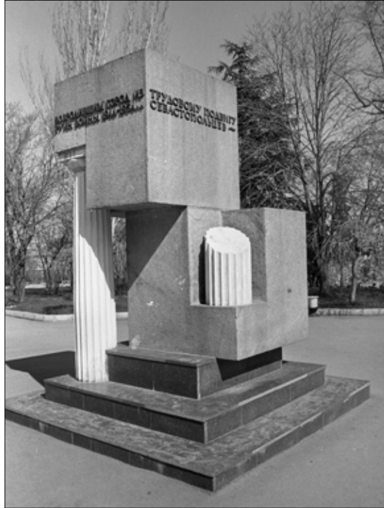
Пам'ятник відбудовникам міста-героя Севастополя. 1988 р. Фото Албулі Н. Державний архів міста Севастополя, фонд фотодокументів, од. зб. 0-14634.

бирали дошки, балки, двері, шифер і відгороджували собі комірку. Наприклад, у шахті ліфта на тросах, що проржавіли, висіла кабіна. А під нею, забивши ґратчасті стіни фанерою і дошками, жила немолода жінка. Кабіна важила не менше півтонни, а жінка вважала, що проживала з комфортом і спокійно спала ночами 14 .