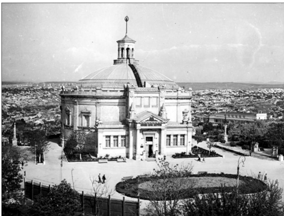
Панорама “Оборона Севастополя 1854–1855 рр.” 1973 р.