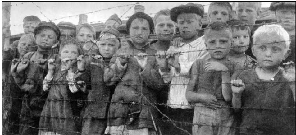
Діти за колючим дротом в одному з концтаборів Німеччини. Липень 1944 р. ЦДКФФА України ім. Г. С. Пшеничного од. обл. 2-154656.

В подборке поданы фотодокументы из фондов ЦГКФФА Украины им. Г. С. Пшеничного периода нацистской оккупации, которые зафиксировали места массового уничтожения людей.