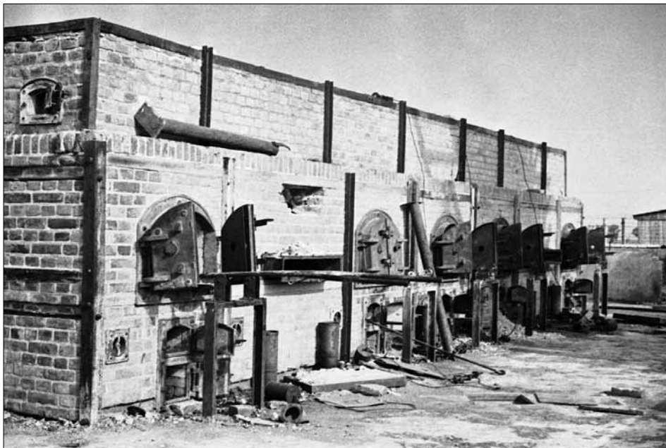
Печі крематорію в концтаборі Майданек. Польща, 1944 р.