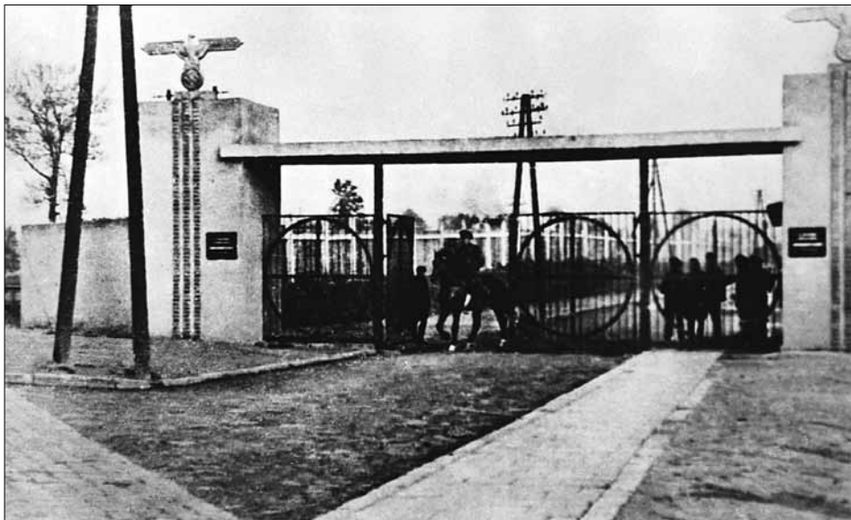
Головний в'їзд до Янівського концентраційного табору, в якому нацисти влаштували "бункери смерті".