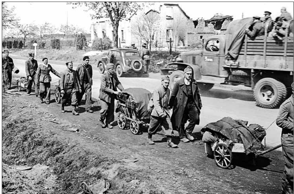
Колишні в'язні концтабору в м. Заган (тепер м. Жагань, Польща) повертаються додому. Німеччина, квітень – травень 1945 р. ЦДКФФА України ім. Г. С. Пиєничного од. обл. 0-161483.