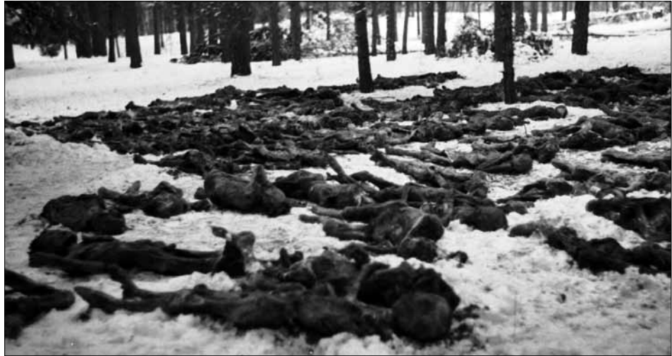
Трупи, викопані з ям на території Сирецького концтабору. Київ, 1944 р. ЦДКФФА України ім. Г. С. Пшеничного од. обл. 0-4223.