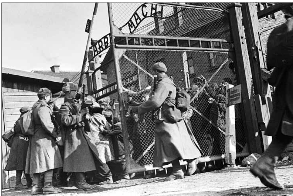
Звільнення радянськими воїнами в'язнів концтабору Освенцім. м. Освенцім (Польща), 1945 р.