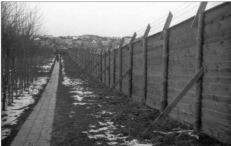
Стіна концентраційного табору в м. Рівному. 1943 р.