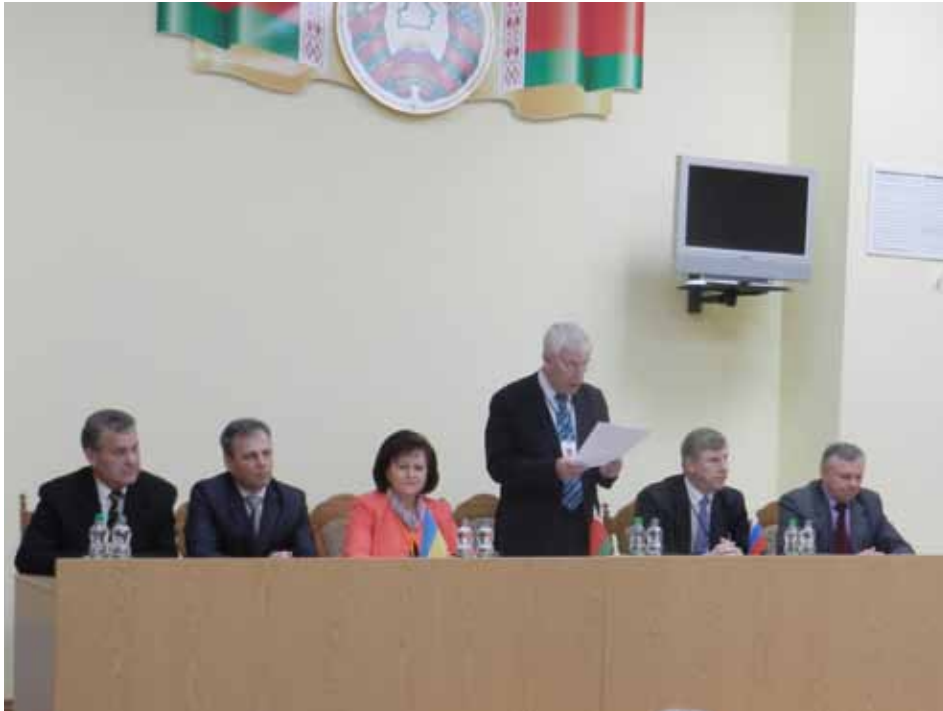
Директор Департаменту з архівів та діловодства Міністерства юстиції Республіки Білорусь В. І. Адамушко відкриває тристоронню зустріч. 29 травня 2013 року, Біловезька пуща, с. Каменюки Брестської області.

підготовленими за документами архіву та виданими друком минулого року.