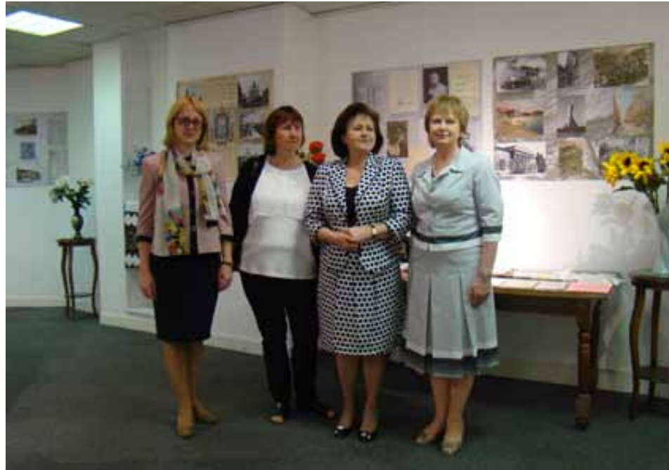
Українська делегація на міжнародній виставці “Столиці слов’янських держав крізь призму рхівних документів” у Парижі.

що відкрилася 6 травня ц. р. у штаб-квартирі ЮНЕСКО в м. Парижі. Українська частина експозиції була представлена на чотирьох стендах.