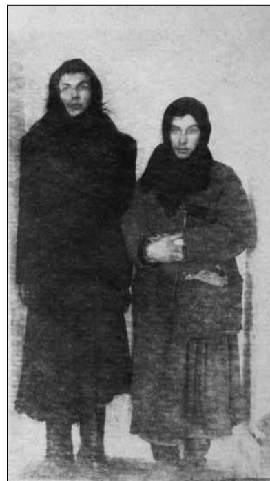
Агенти абверу у жіночому одязі.