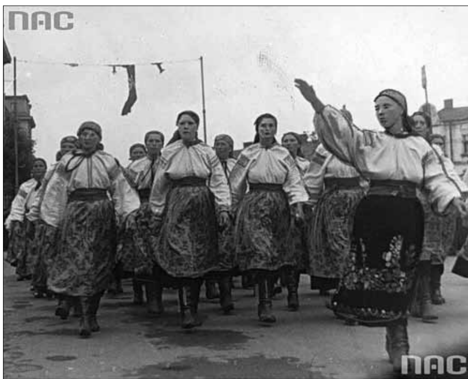
Нацистські вітання українських націоналістів під час параду дивізії СС "Галіція". 1944 р.