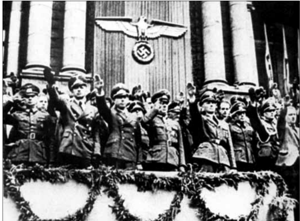
Головна трибуна на параді дивізії СС “Галіція”. Львів, 1944 р.

Фронт рухався на захід, ми втратили Краків, інші території, однак контакти з УПА продовжувались упритул до закінчення війни. Пізніше зв'язки було припинено і лише тому, що стало зрозуміло: якщо про них стане відомо союзникам, це найбільше зможе зашкодити УПА. Чи були контакти її представників із західними союзниками, мені невідомо*.