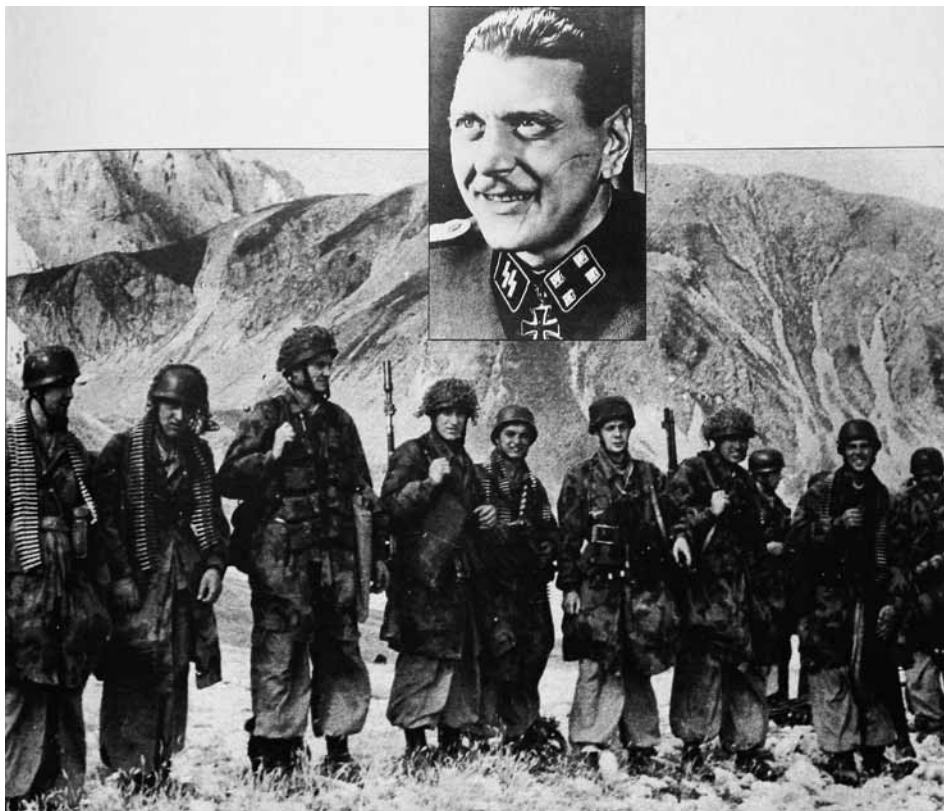
Отто Скорцені і його “мисливці”.

числа колаборантів, але й німців. З цього приводу Гіммлером було видано спеціальний наказ. На перших порах йшлося про добровольців, але з часом у радянський тил “мав бути готовим вирушити будь-який німецький вояк із військ СС і Вермахту” 21 .