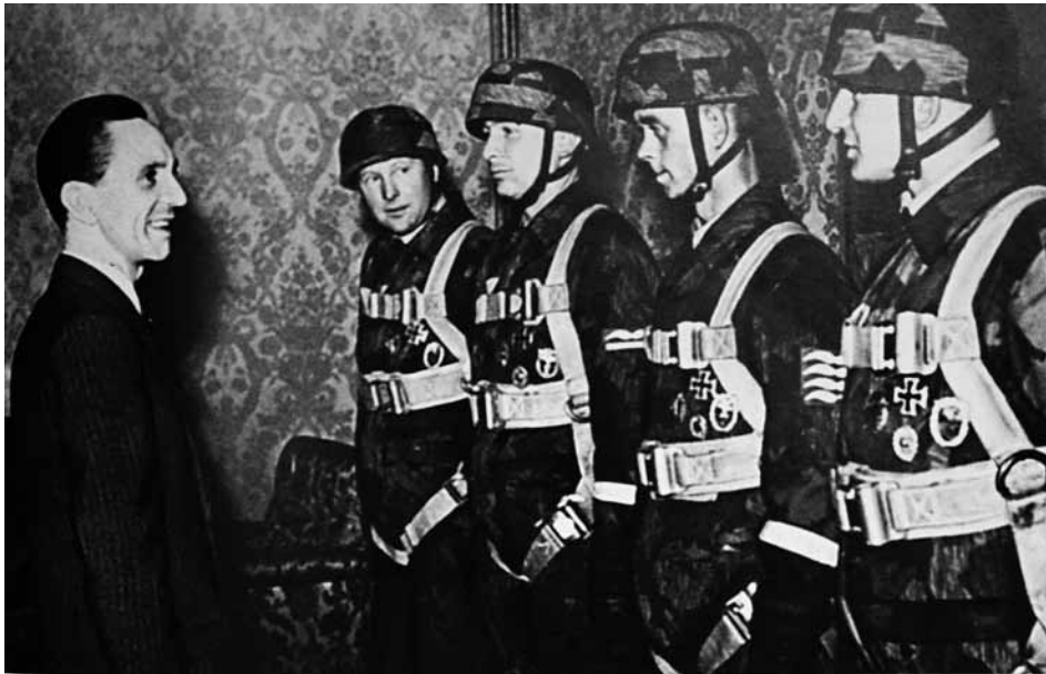
Йозеф Геббельс вітає диверсантів із нагородами.

агентурні українське та польське відділення. Відлітаючи із радянського тилу “Кірна взяв Остапа, того українця, який зустрів його по той бік фронту... Його було призначено начальником українського табору...” 30 При ФАК 202 під командуванням капітана Баума діяла і так звана “Технічна рота”. Її особовий склад готувався виключно до диверсійної роботи. До “справи” підключилася і “господарська школа Південь”, на яку покладалися ті ж самі завдання. У підпорядкуванні абверкоманди перебував і “Польський легіон” (850 осіб), що був сформований із залишків “Армії Крайової”. Очолював його гауптштурмфюрер СС Фукс. У тилу військ союзників легіон “працював” практично у всіх районах Німеччини 30 .