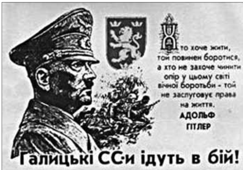
Листівка ОУН. 1944 р.

Налагодили радіозв'язок із Люфтваффе і нам незабаром десантували необхідне для УПА озброєння, одяг та гроші. З допомогою прибулого льотчика поблизу села Степанівка віднайшли місце, де міг приземлитися літак. Це була велика поляна, її обладнали і через кілька днів там сів Ю-52. На ньому до Кракова відлетіла уся моя команда, зв'язковий (з УПА – А. Ч.), 3 чи 4 українці, а також декілька німців, що перебували в УПА*. Останнє засвідчує, що УПА не керувалась нашими наказами, а була союзником по зброї у боротьбі проти Росії... У зв'язку з новим розвитком подій Бандеру та інших українських лідерів у цей період було звільнено із концентраційного табору.