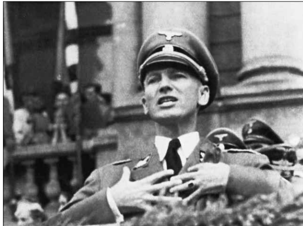
Губернатор дистрикту “Галіція” Отто Вехтер клянеться у “вічній любові” до українського народу. 1944 р.

припасами та спорядженням, щасливо повернувся до рейху. Закінчуючи відеоінтерв’ю, із гордістю згадав: