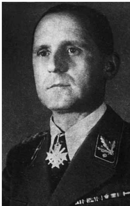
Группенфюрер Генріх Мюллер.

Вермахт, а конкретно абвер (військова розвідка і контррозвідка), з самого початку будівництва збройних сил Німеччини, тобто з 30-х років, підтримував зв'язок з українськими націоналістами, виокремлюючи дві їх частини: ОУН Мельника і ОУН Бандери. Загалом уся робота концентрувалась навколо Бандери. Співпрацюючи з ним, абвер допоміг сформувати два батальйони із добровольців ОУН – “Нахтігаль” і “Роланд”. Вони знаходились у перших лавах Вермахту під час нападу Німеччини на СРСР. У 1941 році вони ж вступали у Львів.