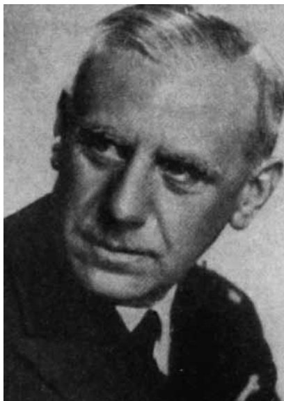
Адмірал Вільгельм Канаріс.

Незважаючи на потуги гітлерівського військово-політичного керівництва, події на радянсько-німецькому фронті розгорталися за непередбачуваним сценарієм. Вкрай невдалим для нацистської Німеччини та багатьох її вищих чинів, зокрема для незмінного упродовж багатьох років очільника абвера адмірала Вільгельма Канаріса, став 1943 рік. Вальтер Шелленберг: “Канаріса стали відверто підозрювати у зраді... До того ж він став працювати все гірше. Не дивлячись на небачений розум, його поведінка стала непередбачувана, і у багатьох склалось враження про поразницькі настрої шефа військової розвідки та контррозвідки... До 1944 р. особисті і професійні недоліки Канаріса настільки скомпрометували його в очах Гітлера, що він був усунутий з посади” 13 .