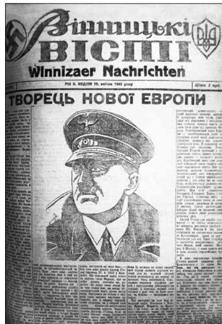
Одне із багатьох масових видань ОУН 1941 року.

підривної роботи, остання діяла у бойових порядках військ Вермахту 5 . Спочатку це була територія Польщі, а з початком війни проти Радянського Союзу тили Південно-Західного та Південного, пізніше Українських фронтів. “У травні 1941 р., – свідчив у СМЕРШі*** фельдфебель