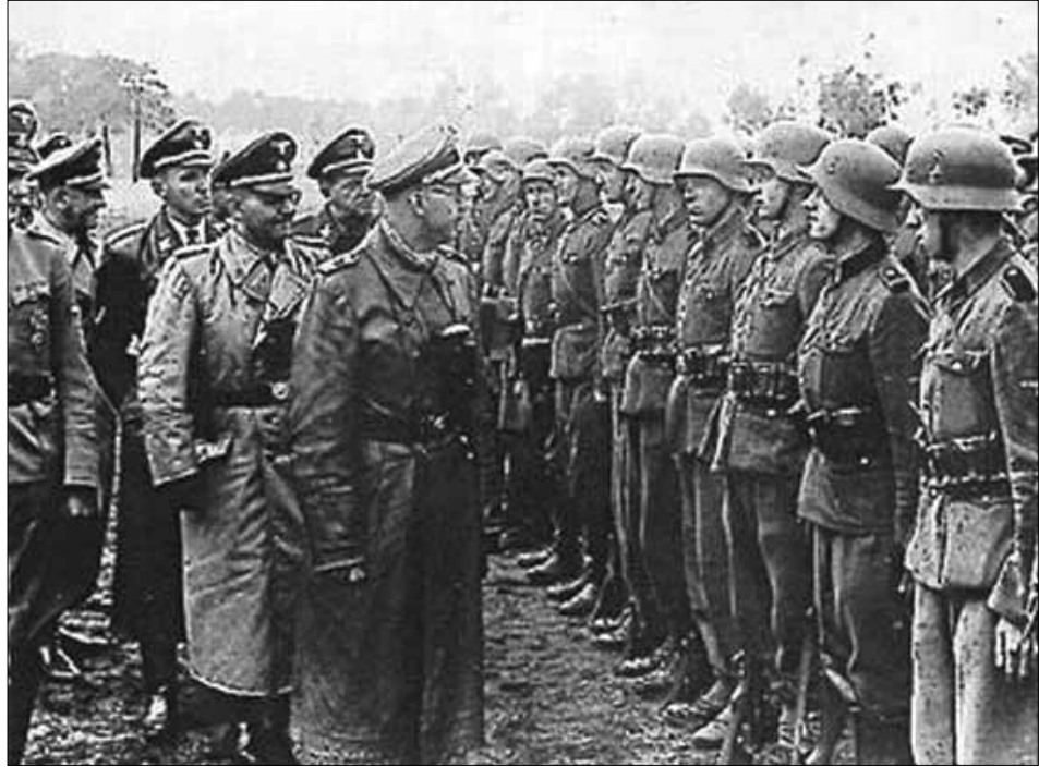
Гімmlер на оглядинах дивізії СС “Галіція”. 1943 р.