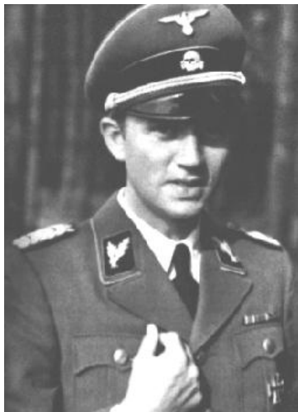
Бригадефюрер СС Вальтер Шелленберг.

заступником у Хелльвіта. Після вбивства у серпні 1944 р. шефа польськими партизанами очолив диверсійний орган. На останній період його існування випав і зірковий час нашого героя – капітана, згодом майора Кірна. Саме тоді він став кавалером щонайменше двох значущих для нього нагород – Лицарського хреста Третього рейху і золотого Хреста заслуги УПА... Під час Великої Вітчизняної війни шлях абверкоманди 202 проліг з району Кракова до Львова. За даними співробітника абвергрупи 220 Йосипа Климчука, з міста Лева команда “передислокувалась до Кременця, Старого Костянтинова (с. Кузьмін), с. Садки, 10 км від Бердичева, далі с. Піковець поблизу Умані” 9 . З вересня 1941 р. до осені 1942 р. абверівці перебували в Полтаві (вул. Монастирська, 14), потім у Харкові, Запоріжжі, Кіровограді та Вінниці – поблизу фронтової ставки Гітлера. З визволенням території України вимушено вирушили зворотним шляхом – спочатку до Львова (вулиця Бема, № 7 і № 18), звідти до Кракова. Тут же (по вулиці Стражевського, 42/10) облаштувався і диверсійний навчальний центр. У січні 1945 р. штаб команди перебрався до міста Коллін, потім Гросс-Влосск (Чехословаччина). Тут її застала капітуляція нацистської Німеччини 11 .