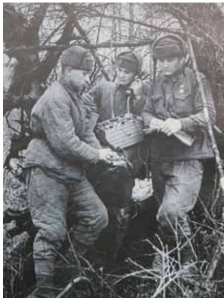
Диверсанти за роботою у радянському тилу.

солдатськими книжками та цивільними паспортами (“Kennkarten”). Одним із центрів з їх виготовлення став спецпідрозділ “9-Staffel”, місце перебування якого змінювалося залежно від ситуації на фронтах. Останнім з них став замок одного із австрійських вельмож поблизу Гросс-Воссека і Коліна 12 .