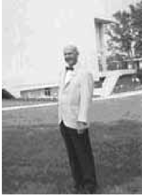
Крістофер Кріттенден, Секретар Історичної комісії штату Північна Кароліна у 1935–1968 рр., 1-й Президент Американської асоціації історії штатів і округів; 9-й віце-президент (1944–1945 рр.), 6-й Президент Товариства американських архівістів (1947–1949 рр.), біля нового будинку Департаменту архівів і історії Північної Кароліни

у ході проекту описи документів округів. На проекті працювало більше сотні співробітників. Крім укладання описів, вони займались систематизацією документів в установах округів.