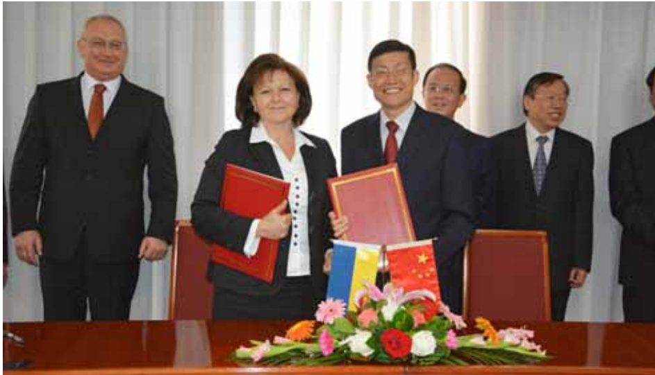
Голова Державної архівної служби України О. Гінзбург і Начальник Державного архівного управління КНР Я. Дунцюань після підписання угоди про співпрацю. Пекін (Китай), 10 вересня 2013 року.