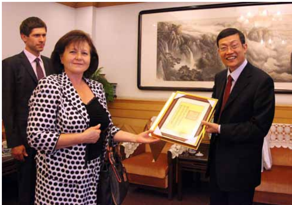
Голова Державної архівної служби України О. Гінзбург та Начальник Державного архівного управління КНР Я. Дунцоань.