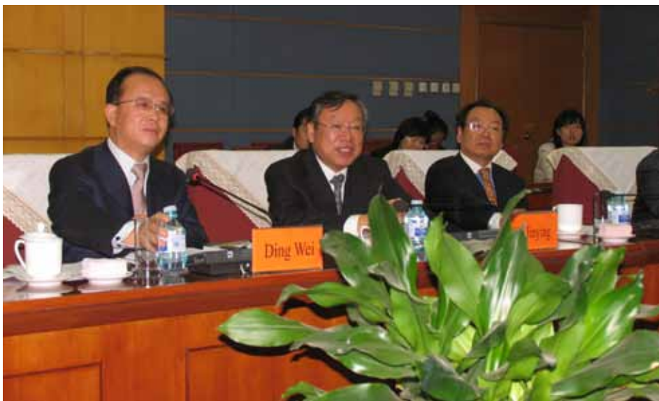
Члени китайської сторони другого засідання українсько-китайської Підкомісії з питань співробітництва у сфері культури. Зліва направо: Голова підкомісії, Перший заступник Міністра культури КНР Ді Вей, Заступник Міністра культури КНР Чен Ксіогуан, Голова асоціації музеїв КНР Сі Яньін.