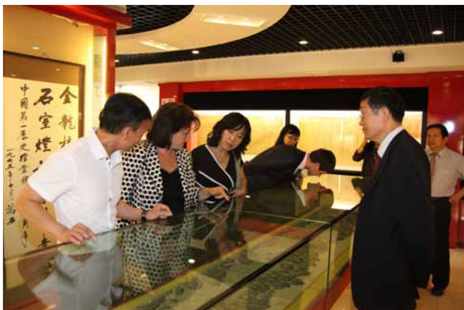
Українська делегація ознайомлюється з умовами зберігання та складом документів Першого історичного архіву КНР.