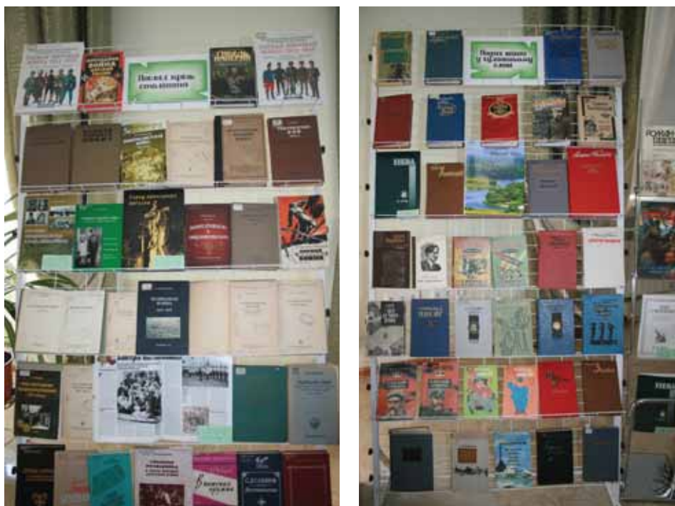
Виставки документів і книг з фондів Державного архіву Миколаївської області та Миколаївської обласної наукової бібліотеки імені Олексія Гмирьова, підготовлені до 100-річчя початку Першої світової війни.