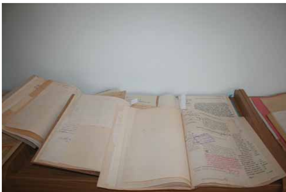
Виставки документів і книг з фондів Державного архіву Миколаївської області та Миколаївської обласної наукової бібліотеки імені Олексія Гмирьова, підготовлені до 100-річчя від дня початку Першої світової війни.