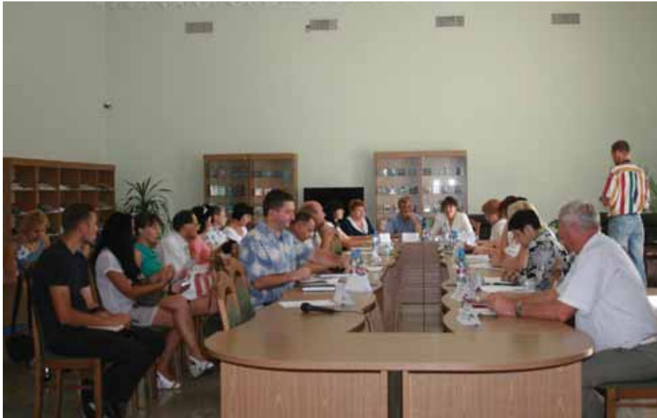
Засідання круглого столу, присвяченого 100-річчю початку Першої світової війни (читальня зала Миколаївської обласної наукової бібліотеки імені О. Гмирьова).