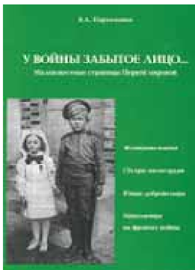
Обкладинка книги Владислава Пархоменка “У войны забытое лицо... Малоизвестные страницы Первой мировой”, підготовленої на підставі дослідження за документами Держархіву Миколаївської області.

Керівник обласного центру пошукових досліджень та редакційно-ви-