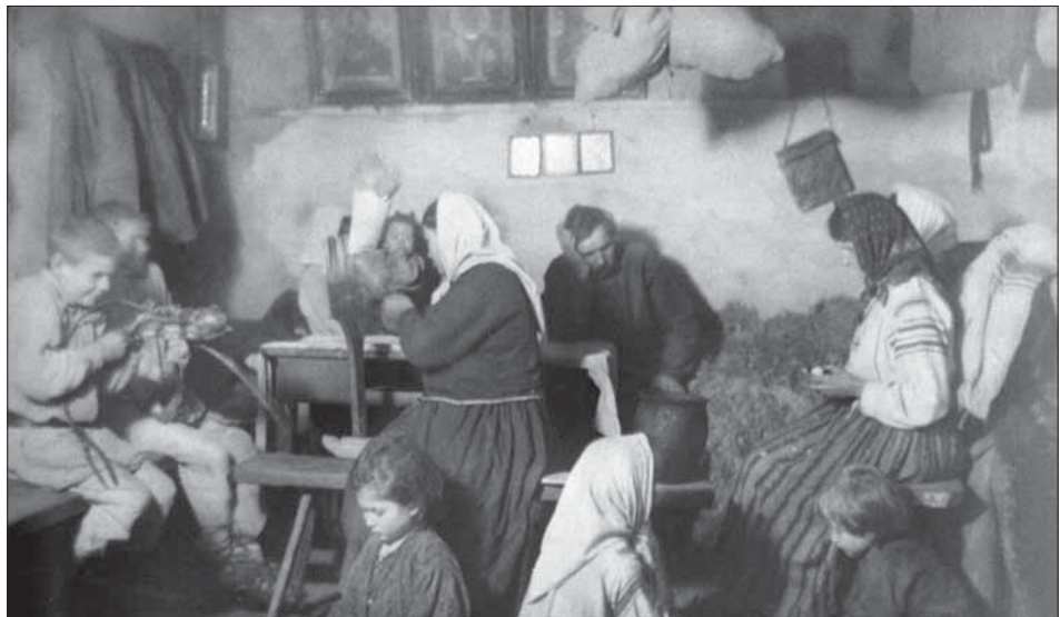
Евакуйовані з Полісся селяни у хаті на Волині, 1914–1917 рр. ЦДКФФА України ім. Г. С. Пишеничного, од. обл. 0-235544.