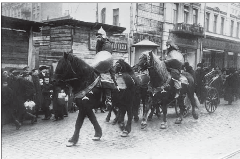
Карнавал на вулиці м. Києва під час Першої світової війни, 1914–1916 рр.