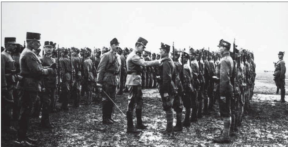
Спадкоємець престолу Австро-Угорщини Карл Франц Йосип під час огляду частин українських січових стрільців, 26 липня 1916 р.

ЦДКФФА України ім. Г. С. Пшеничного, од. обл. 2-147029.