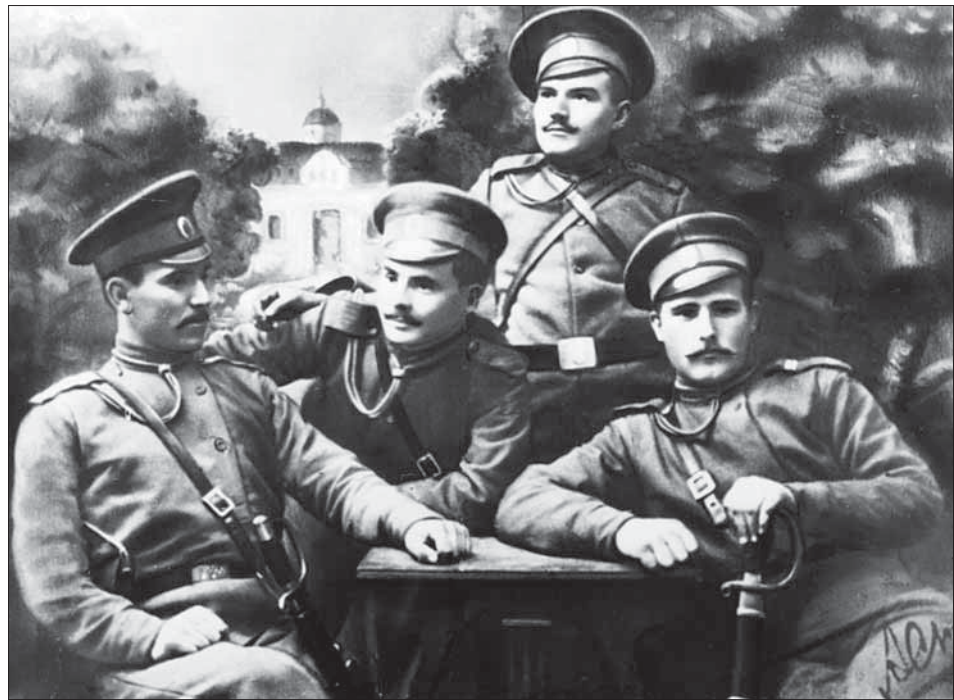
Група військових російської армії під час Першої світової війни. Праворуч – український письменник Олесь Досвітній, О. Ф. Скрипаль-Мищенко, 1914 р. ЦДКФФА України ім. Г. С. Пшеничного, од. обл. 0-178494.

Тож, зважаючи на багатоплановість зібраного матеріалу, можна цілком ствердно говорити про доволі повне й об'єктивне представлення Першої світової війни у фотодокументах ЦДКФФА України ім. Г. С. Пшеничного.