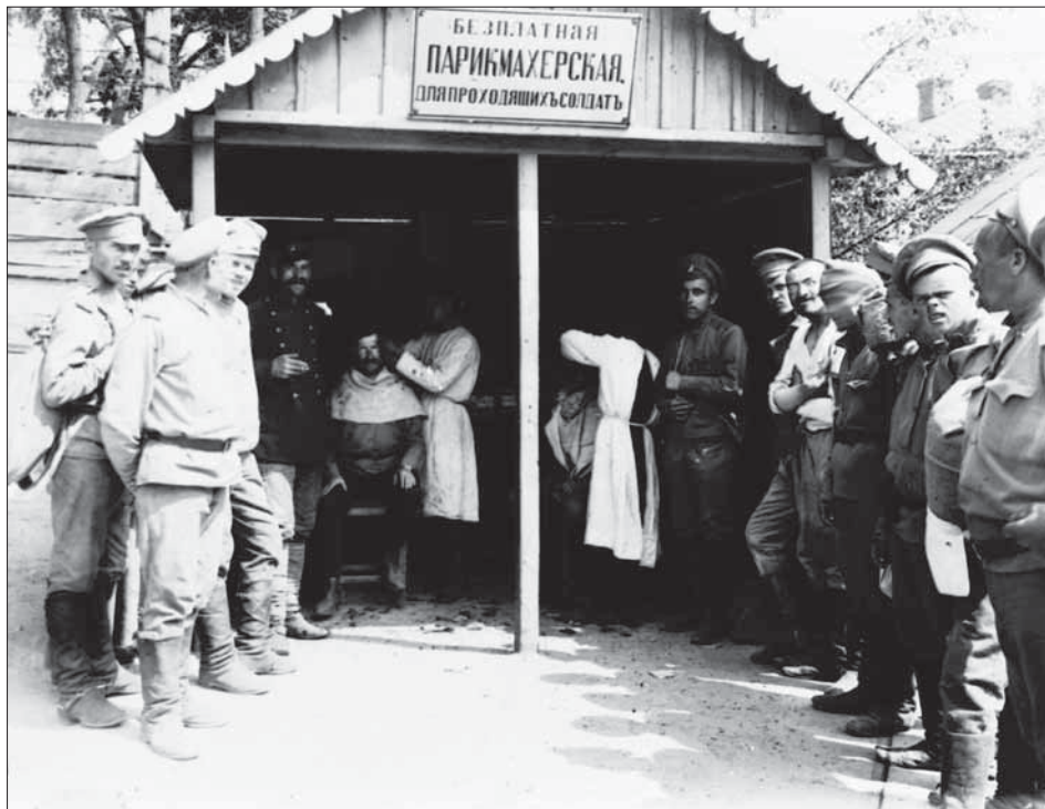
Безплатна похідна перукарня Всеросійського земського союзу для військових. Південно-Західний фронт, м. Рівне, 1916 р. ЦДКФФА України ім. Г. С. Пшеничного, од. обл. 4-603.