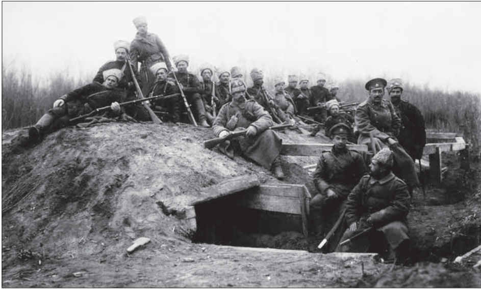
Російський імператор Микола II серед поранених у Кам'янець-Подільському шпиталі, 1915 р.