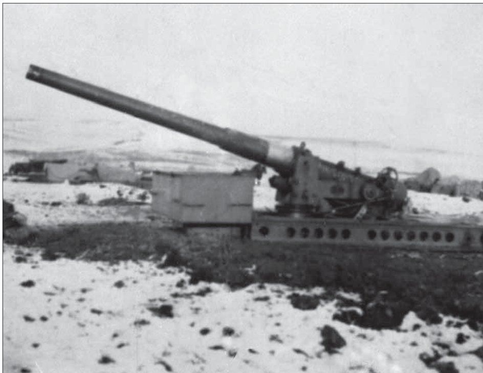
Гармати 3-го Донського артилерійського дивізіону на позиції у м. Новоселиця, 1916 р. ЦДКФФА України ім. Г. С. Пиєничного, од. обл. 0-188790.