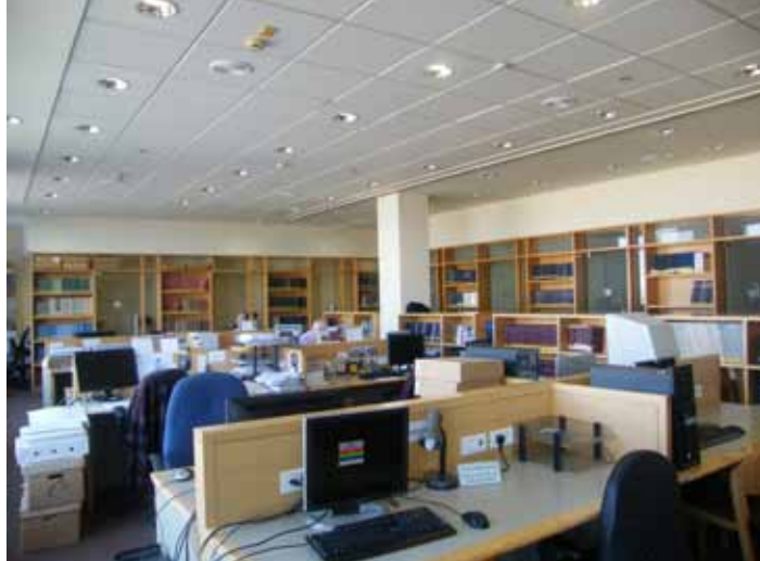
Читальна зала Архіву Яд Вашем. Фото Л. Левченко, 2014 р.