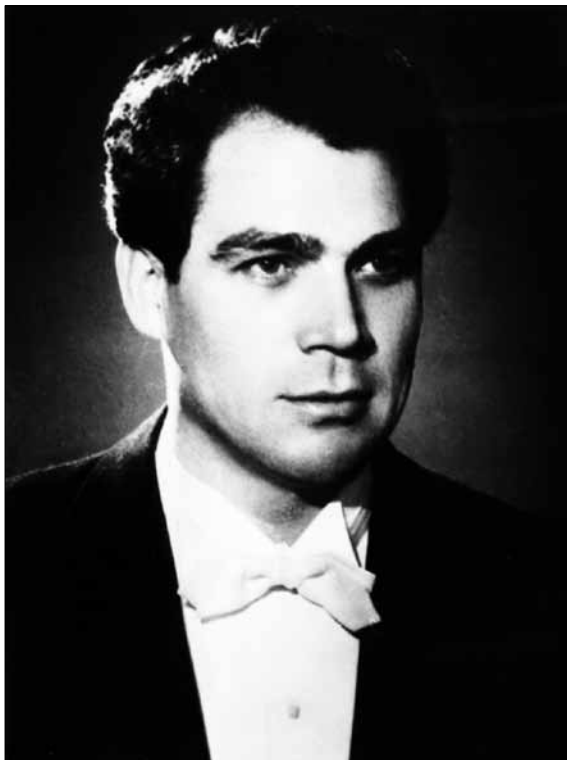
Народний артист УРСР Д. М. Гнатюк – соліст Державного театру опери й балету УРСР ім. Т. Г. Шевченка. 1950-і рр. ЦДКФФА України ім. Г. С. Пшеничного, од. обл. 0-183627.