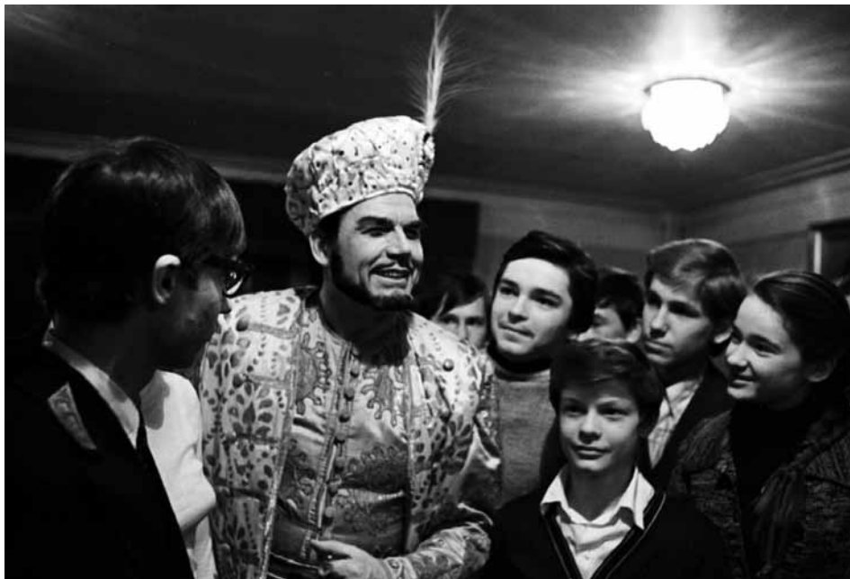
Соліст Державного театру опери й балету УРСР ім. Т. Г. Шевченка, народний артист СРСР Д. М. Гнатюк під час розмови з учнями профтехучилищ м. Києва. 10 лютого 1980 р.