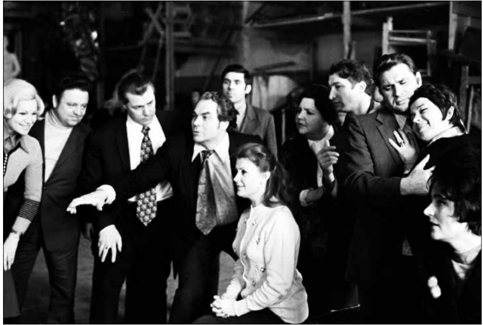
Народний артист СРСР Д. М. Гнатюк (у центрі) проводить репетицію опери І. І. Дзержинського “Тихий Дон” з артистами Державного театру опери й балету УРСР ім. Т. Г. Шевченка. 3-й ліворуч – народний артист СРСР А. Ю. Мокренко.

Київ, 27 січня 1976 р.