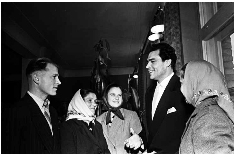
Народний артист СРСР Д. М. Гнатюк (2-й праворуч) під час бесіди з відвідувачами музею с. Ксаверівка Гребінківського району Київської області. 1960 р. од. обл. 0-209221.