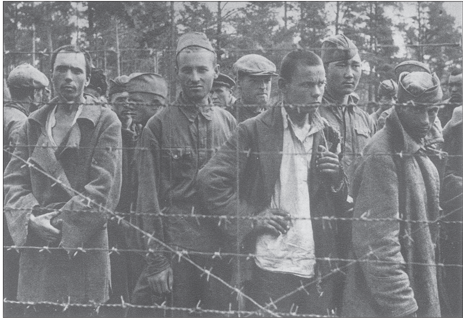
Фото радянських бранців. Німецький плакат, віддрукований у липні 1941 р.

У радянській історіографії тема історії мільйонів військовополонених була майже закритою і зрозуміло чому. Радянське керівництво було зацікавлено у приховуванні правдивих масштабів прорахунків і поразок Червоної армії у 1941–1942 рр., перш за все тому, що саме воно й було основним їх винуватцем. Після розвалу СРСР у 1994 р. російськими архівістами видано "Справочник о местах хранения документов о немецко-фашистских лагерях, гетто, других местах принудительного содержания и насильственном вывозе граждан на работы в Германию и другие страны Европы в период Великой Отечественной войны 1941–1945 гг.", що містив відповідні дані й в Україні. Після виходу 23 березня 2000 р. Закону України "Про жертви нацистських переслідувань" і в незалежній Україні виникла нагальна потреба у ґрунтовному виданні, що висвітлювало б цю тему. І воно побачило світ з такими вихідними даними і назвою: Державний комітет архівів України, Український національний фонд "Взаєморозуміння і примирення" при Кабінеті Міністрів України. Довідник про табори, тюрми та гетто на окупованій території України (1941–1944)/Упоряд. М. Г. Дубик. – К., 2000. У цьому виданні паралельними текстами українською й німецькою мовами йдеться про різні категорії таборів для цивільного населення, військовополонених, тюрми та гетто, на завершення подаються географічні покажчики та перелік використаних архівних фондів.