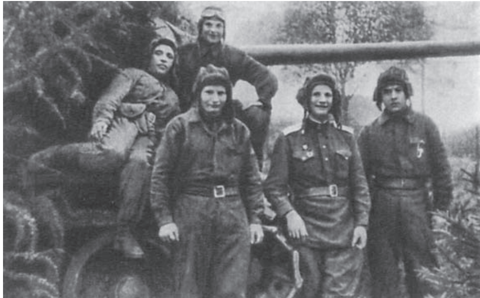
Екіпаж танка Т-34-85 № 24 гвардії лейтенанта Івана Григоровича Гончаренка (другий справа у нижньому ряду).

рійські установки (САУ) ворога відкрили вогонь по головній машині. Між екіпажем Гончаренка і противником зав'язалася артилерійська дуель. У ході бою бійці-танкісти знищили одну з гармат і почали прорив через Манесов міст, проте фаустникам удалося підбити “тридцятичетвірку”. У танк влучив снаряд, і він загорівся. Екіпаж Гончаренка вступив у нерівний бій із 13 самохідними зброями німців. Утримуючи переправу, танкісти вогнем своєї машини знищили ще 2 артилерійські установки. Івана Григоровича було важко поранено, однак офіцер, стікаючи кров'ю, продовжував вести бій. Другим попаданням у танк Іван Гончаренко був убитий.