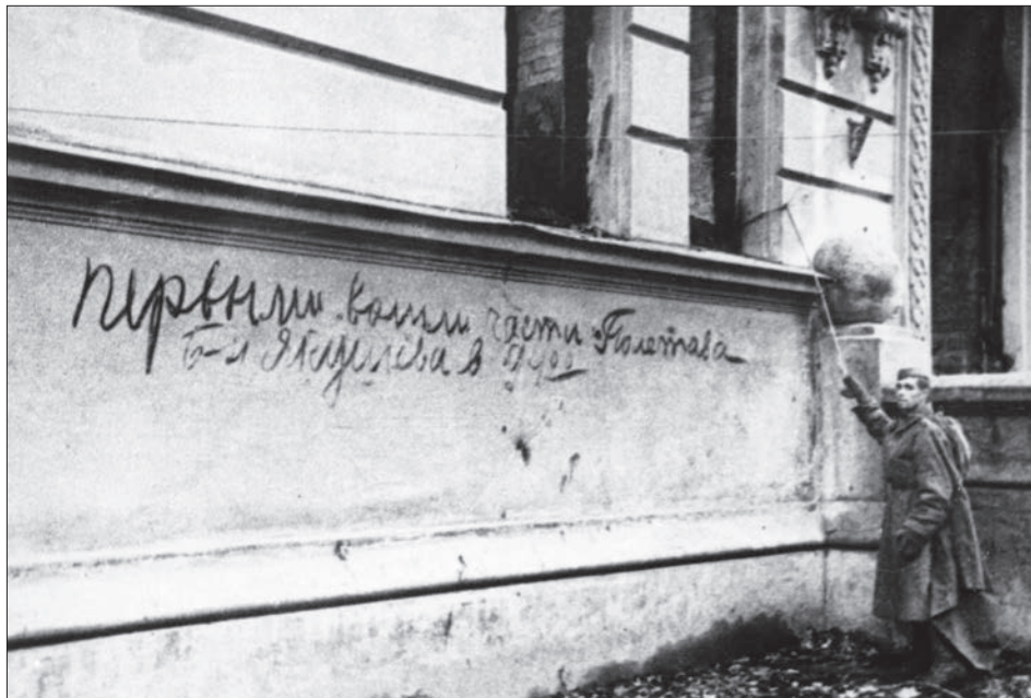
Напис на будівлі бібліотеки ім. ВКП(б) у перші дні звільнення Києва від нацистів. Листопад 1943 р.

ЦДКФФА України ім. Г. С. Пшеничного, од. обл. 0-74764.