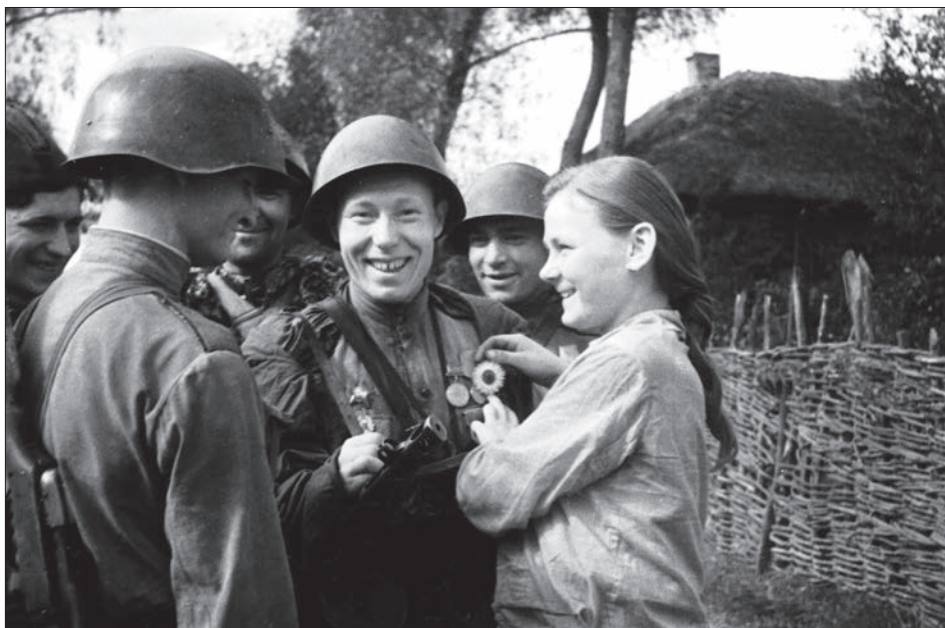
Зустріч радянських солдат із жителями одного із звільнених сіл. Україна, 1944 р.