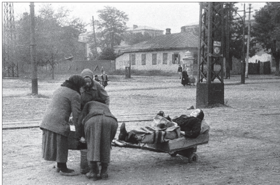
Мешканці, забрані німцями на каторгу, повертаються у рідне місто. Дніпропетровськ, 27 жовтня 1943 р. ЦДКФФА України ім. Г.С. Пиєничного, од. обл. 0-11697.