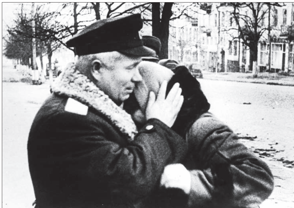
Член військової ради 1-го Українського фронту М. С. Хрущов у звільненому від нацистів Києві. Листопад 1943 р.