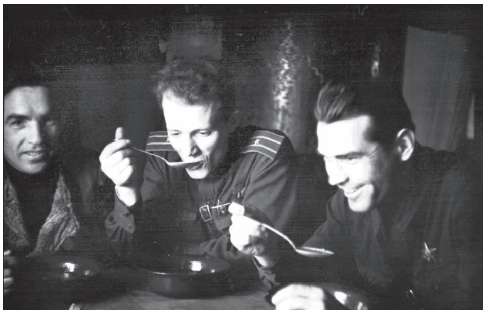
Офіцери однієї з частин 1-го Українського фронту. Україна, 1943–1944 р. Автор зйомки В. І. Орлянкін.

ЦДКФФА України ім. Г. С. Пиєничного, од. обл. 0-11663.