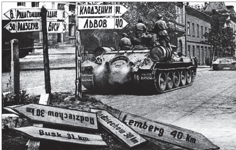
Радянські танки на вулиці одного з населених пунктів Львівщини. 1944 р. ЦДКФФА України ім. Г. С. Пиєничного, од. обл. 0-143110.