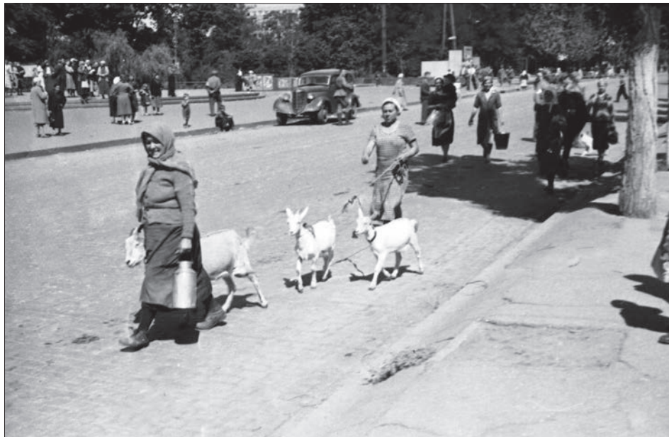
Жителі м. Харкова повертаються у звільнене місто. Харків, 23 серпня 1943 р. ЦДКФФА України ім. Г. С. Пшеничного, од. обл. 0-29293.

Публикується подборка фотодокументів із фондів Центрального державного кінофотофоноархіву України ім. Г. С. Пшеничного, посвяченна 70-й годовщині Перемоги над нацизмом в Європі.