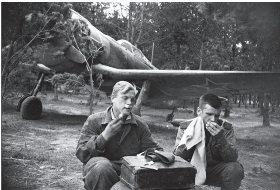
Льотчики однієї з частин 1-го Українського фронту під час відпочинку. Україна, 1943–1944 рр.