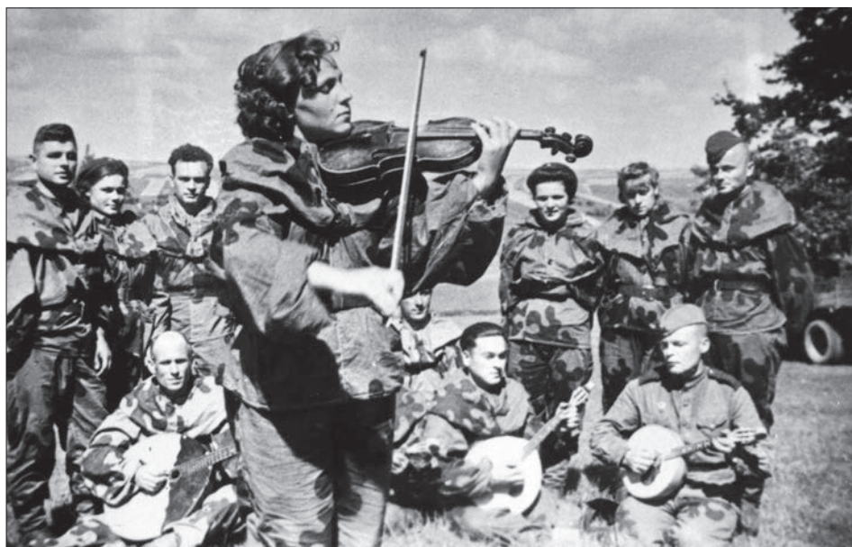
Воїни однієї з частин 52-ї армії 2-го Українського фронту під час відпочинку.

ЦДКФФА України ім. Г. С. Пшеничного, од. обл. 0-160779.