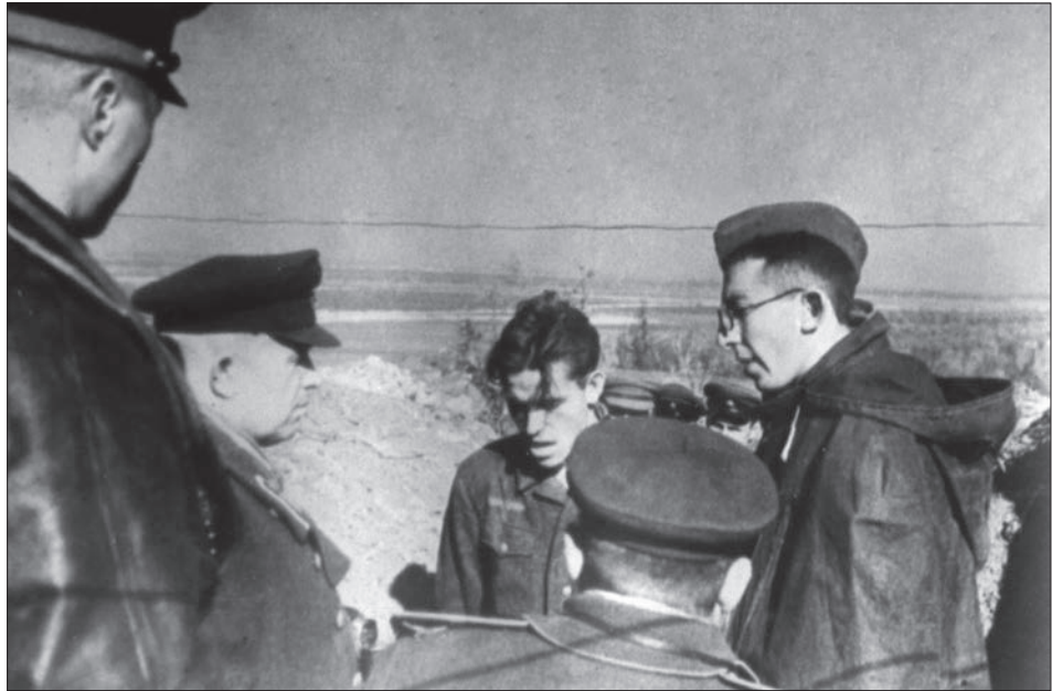
Секретар ЦК КПУ М. С. Хрущов і генерал армії М. Ф. Ватутін допитують полоненого німця в окопах під м. Києвом. Жовтень–листопад 1943 р.