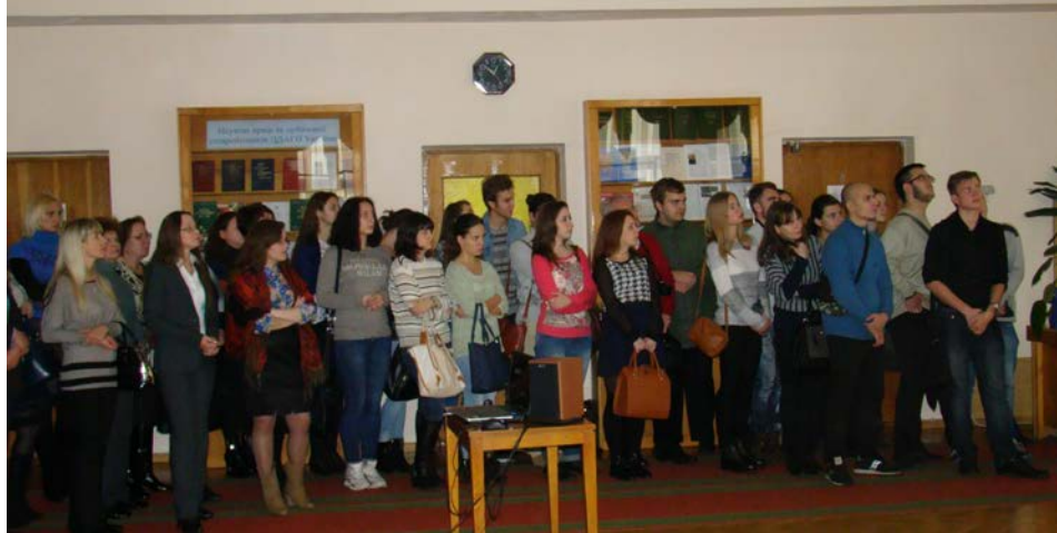
Студенти Київського університету імені Бориса Грінченка та інші гості під час відкриття виставки документів, присвяченої 70-річчю заснування ООН. ЦДАГО України, 23 жовтня 2015 р.

нував пам'ять Г. Й. Удовенка (міністра закордонних справ України в 1994–1998 роках), з яким йому довелося працювати. Питання важливості дотримання принципів Статуту ООН та виконання основної місії цієї міжнародної організації – забезпечення миру в усьому світі – торкнувся у своєму виступі В. С. Огризко. Представляючи Департамент міжнародних організацій МЗС України, А. П. Бешта відзначив високий рівень відповідальності сучасних українських дипломатів і не оминув увагою результати ювілейної 70-ї сесії Генеральної Асамблеї ООН та її значення для України. Директор Інституту історії України НАН України В. А. Смолій акцентував увагу присутніх на важливості збереження національної пам'яті та ролі в цьому процесі державних архівних установ.