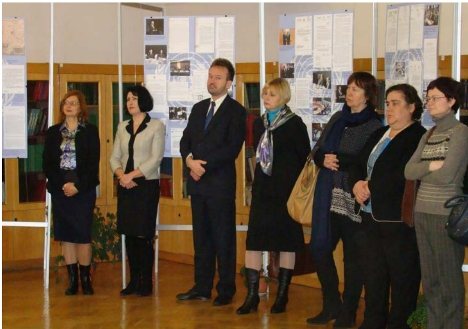
Керівники державних архівів України під час відкриття виставки документів, присвяченої 70-річчю заснування ООН. ЦДАГО України, 23 жовтня 2015 р.