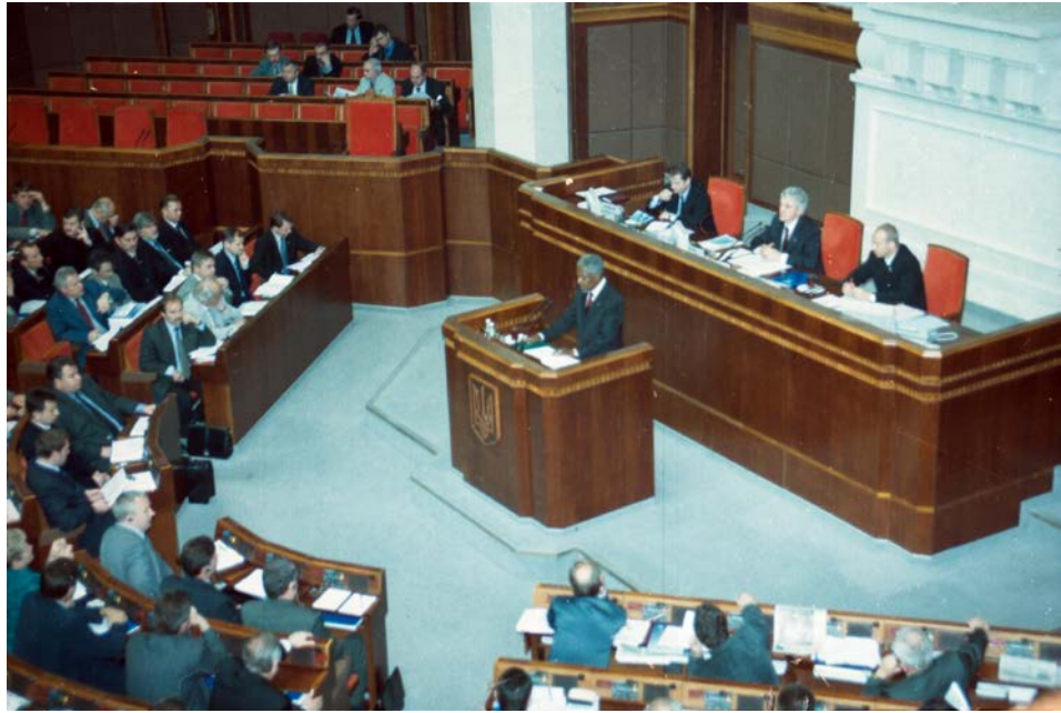
Генеральний секретар ООН Кофі Аннан під час виступу на засіданні Верховної Ради України. м. Київ. 4 червня 2002 р. ЦДКФА України ім. Г. С. Пшеничного, од. обл. 0-240895.

дачі Дипломатичної академії при МЗС України, студенти Київського університету імені Бориса Грінченка, директори та відповідальні працівники державних архівних установ, представники громадськості, засобів масової інформації.