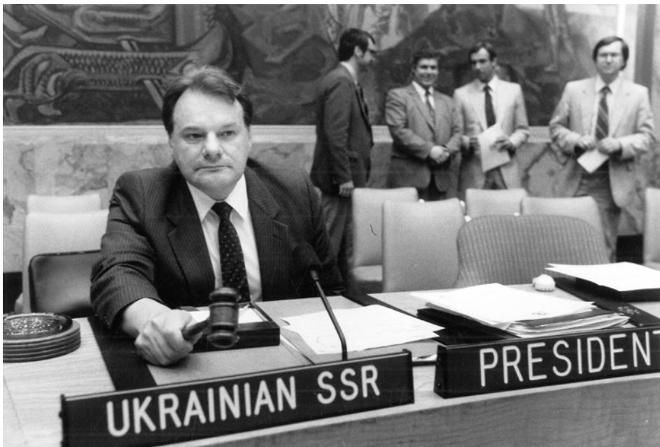
Постійний представник Української РСР при ООН Г. Удовенко головує в Раді Безпеки. м. Нью-Йорк (США). 1985 р. ГДА МЗС України, ф. 5, оп. 9, спр. 412.