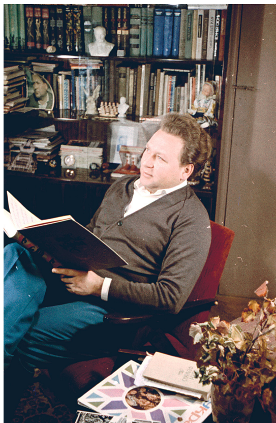
Український композитор, заслужений діяч мистецтв УРСР О. І. Білаш у робочому кабінеті. Київ, 1969 р. ЦДКФФА України ім. Г. С. Пиєничного, од. обл. 0-122692.