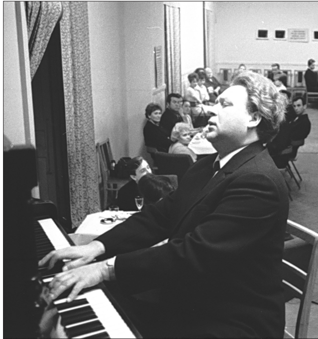
Український композитор, заслужений діяч мистецтв УРСР О. І. Білаш під час зустрічі з робітниками одного із київських заводів. Київ, 1969 р. Автор зйомки С. Белозьоров. ЦДКФФА України ім. Г. С. Пшеничного, од. обл. 0-122695.