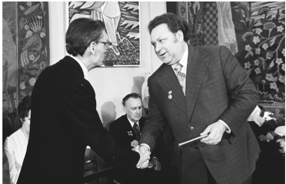
Голова Комітету з Державної премії УРСР ім. Т. Г. Шевченка академік М. З. Шамота вручає диплом і почесний знак лауреата премії композитору О. І. Білашу. Київ, 25 березня 1975 р.