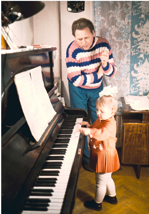
О. І. Білаш – український композитор, заслужений діяч мистецтв УРСР вдома з дочкою. Київ, 1969 р. Автор зйомки С. Белозьоров. ЦДКФФА України ім. Г. С. Пиєничного, од. обл. 0-122694.