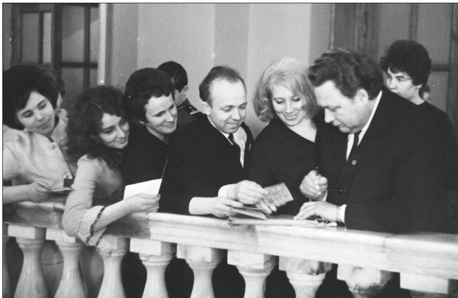
Український композитор, заслужений діяч мистецтв УРСР О. І. Білаш дає автографи делегатам XXI з'їзду ЛКСМ України.

ЦДКФФА України ім. Г. С. Пшеничного, од. обл. 0-165267.