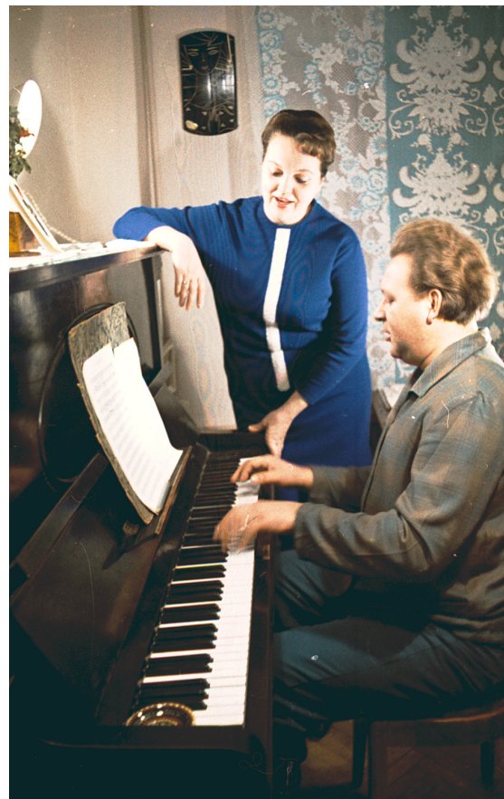
Український композитор, заслужений діяч мистецтв УРСР О. І. Білаш і заслужена артистка УРСР Л. І. Остапенко під час розучування нової пісні. Київ, 1969 р. Автор зйомки С. Белозьоров. ЦДКФФА України ім. Г. С. Пшеничного, од. обл. 0-122696.