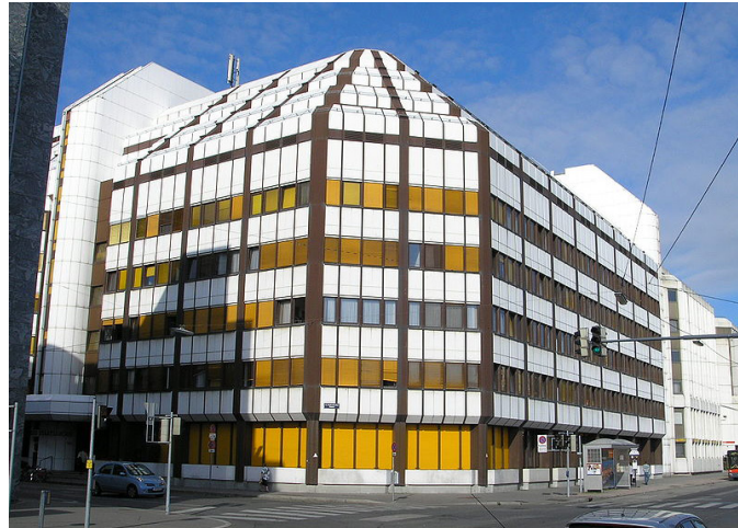
Центральна будівля Австрійського державного архіву у Відні (Nottendorfer Gasse, 2, Wien-Erdberg).

завданнями архіву є організація комплектування фондів поточною документацією державних органів влади та управління (у т. ч. з електронними носіями), їх подальша класифікація, опрацювання та організація використання.