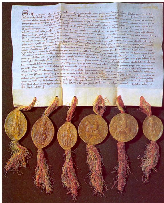
Лист німецьких князів до папи римського Боніфація VIII з повідомленням про обрання герцога Албрехта I Австрійського королем Німеччини. 28 липня 1298 р. Документ з фондів Архіву цісарського дому, двору і держави. Репродукція з видання: The Treasure Houses of Austria: The Austrian State Archives. – Vienna: Federal Press Service, 1996. – P. 19.

Відень-Ердберг (Vienna-Erdberg; Nottendorfer Gasse, 2), до якої 1988 р. було переведено Генеральну дирекцію австрійських архівів, центральну архівну бібліотеку та такі архівні підрозділи: Загальний адміністративний архів (Allgemeines Verwaltungsarchiv), Архів Республіки (Archiv der Republik), Воєнний архів (Kriegsarchiv) та Архів фінансів і надвірної палати (Finanz- und Hofkammerarchiv).