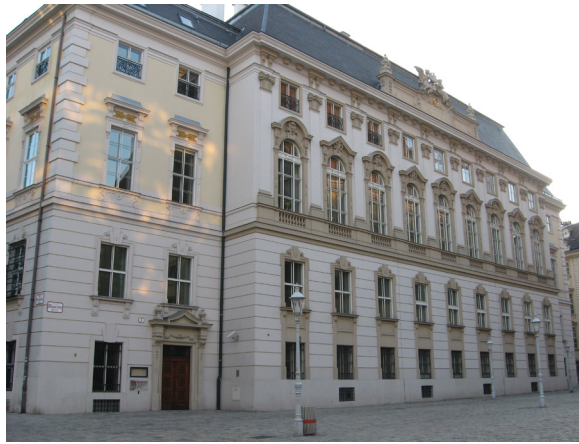
Історична будівля Австрійського державного архіву у Відні (Minoritenplatz, 1), у якій розташований Архів цісарського дому, двору і держави. 2011 р.