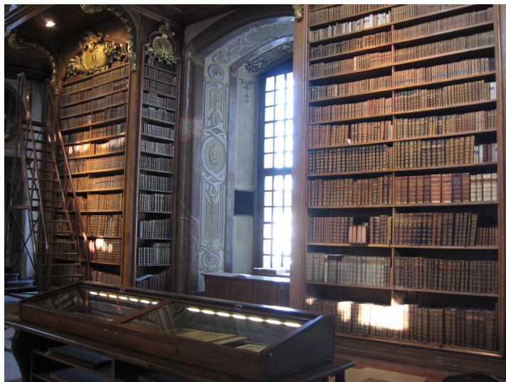
Австрійська національна бібліотека, відділ рукописів та рідкісних книг. 2011 р.

колекція рукописів та інкунабул. Загалом у бібліотечних фондах зберігається понад 7,5 млн примірників книг, близько 45 тис. рукописів, близько 8 тис. інкунабул, 284 тис. автографів, а також карти, глобуси, картини, фотографії, плакати, партитури відомих композиторів.