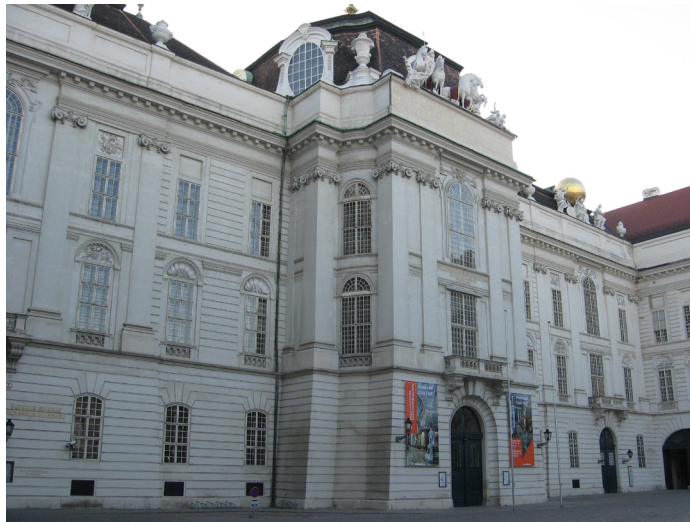
Історична будівля Австрійської національної бібліотеки у палаці Гофбург (Josephplatz, 1), де зберігається колекція рукописів та інкунабул. 2011 р.

tungsarchiv ) та Архів фінансів і надвірної палати (Finanz- und Hofkammerarchiv) . Загальний адміністративний архів почав формуватися ще за часів імператриці Марії Терезії. Основу його зібрання склали документи з внутрішнього управління імперією, починаючи з XVI ст., у т. ч. Державний архів внутрішніх справ і юстиції та Архів міністерства освіти. Архівні фонди включають документи з внутрішнього управління, судочинства, освіти, сільського господарства, торгівлі, транспорту. Окремими структурними підрозділами є архіви дворянства, особові та родинні фонди, а також колекція мап, планів, плакатів та фотографій. У 2003 р. фонди архіву поповнила аудіовізуальна колекція, основу якої складають переважно фотографії (близько 67 тис. світлин), передані Федеральною прес-службою. Загальна довжина архівних полиць цієї установи сьогодні сягає 12 тис. 700 лінійних метрів 28 .