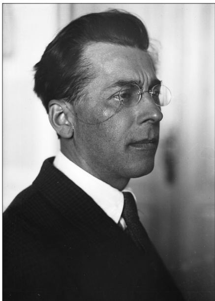
П. Г. Тичина, м. Харків, 1934 р. Из фондів ЦДКФФА України, од. обл. 2-2433.

(182 од. обл.) та фонодокументи (43 од. обл.).