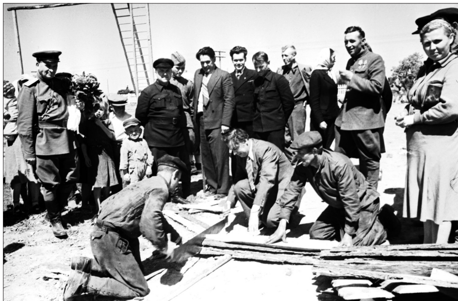
Міністр освіти УРСР П. Г. Тичина (в центрі) під час неділянка з відбудови та ремонту шкіл, Житомирська область, червень 1946 р.

Із фондів ЦДКФФА України, од. обл. 0-191017.