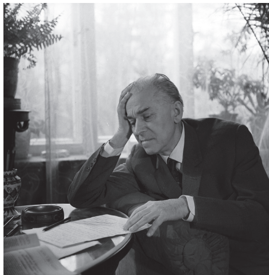
П. Г. Тичина – український поет, академік АН УРСР, м. Київ, січень 1966 р. Із фондів ЦДКФФА України, од. обл. 2-155572.

мені поле” (од. зб. КД-93, од. обл. 708), “Мій травню золотий” (од. зб. КД-93, од. обл. 710), “В час вечірнього розмаю” (од. зб. М-23360, од. обл. 10307), “Партію славить народ український” (од. зб. М-7954, од. обл. 19521), “Партія веде” (од. зб. М-11131, од. обл. 25121), виступи у передачах “Писати тільки правду” (1967 р., од. зб. М-6081, од. обл. 18142), “Лауреати Шевченківської премії” (1962 р., од. зб. М-7391, од. обл. 18541) тощо.