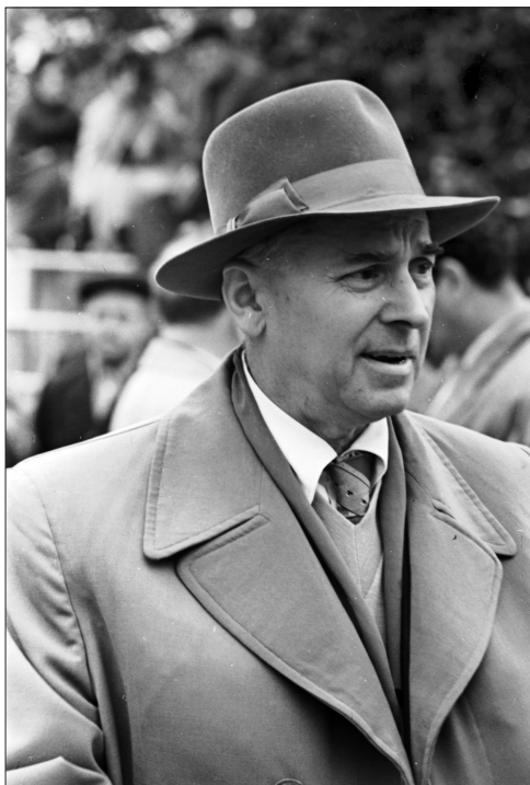
П. Г. Тичина – академік АН УРСР, м. Київ, травень 1962 р.

фільм. Нова інформація про поета, організована у вигляді тексту-сценарію, “розархівовується засобами кінозображення” 13 . Підпорядкований вербальній складовій візуальний ряд містить різні історичні документи, фотографії П. Тичини та інших персоналій, кадри кінохроніки, натурної зйомки, що топографічно точно відтворюють місця перебування митця, візуально посилюють емоційний вплив поезії, яка звучить у кадрі.