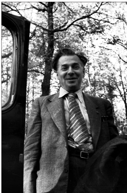
Міністр освіти УРСР П. Г. Тичина, м. Київ, червень 1946 р. Із фондів ЦДКФФА України, од. обл. 0-191027.

Третя група кінодокументів відтворює виконання П. Тичиною власних творів. Цей кіноматеріал синтезує зображувальну, знакову та