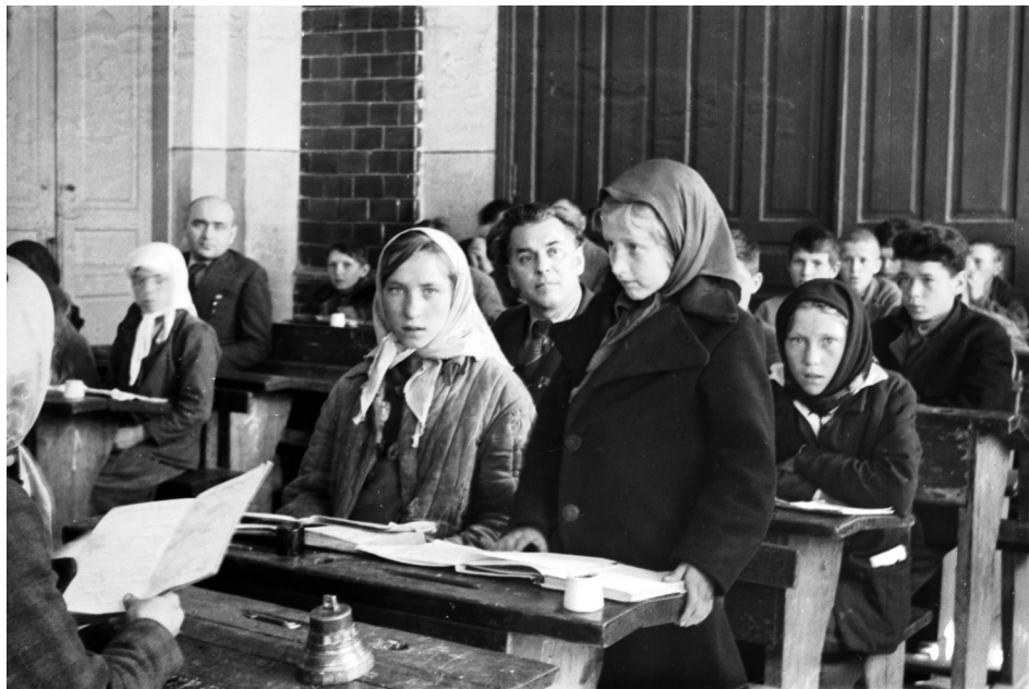
Міністр освіти УРСР П. Г. Тичина на уроці в одній із київських шкіл, м. Київ, 1945 р.