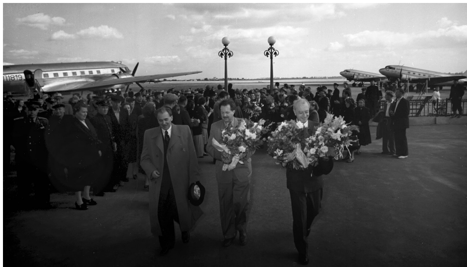
Зустріч у Київському аеропорту представників французької парламентської делегації. Перший зліва на передньому плані – Голова Верховної Ради УРСР П. Г. Тичина, м. Київ, 21 вересня 1955 р.

Із фондів ЦДКФФА України, од. обл. 2-157952.