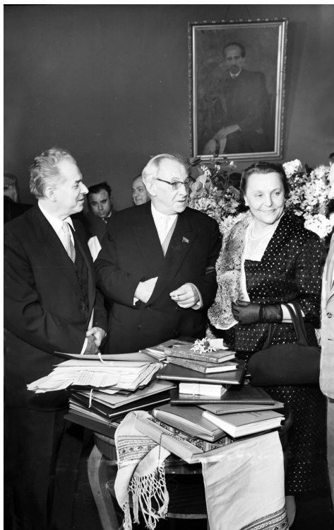
П. Г. Тичина спілкується з народною артисткою СРСР Н. М. Ужвій та поетом-академіком М. Т. Рильським у Колонному залі Київської філармонії під час літературного вечора, м. Київ, 19 березня, 1960 р. Із фондів ЦДКФФА України, од. обл. 2-69365.

До дев’яносторіччя поета (1981 р.) режисером М. Лінійчук була здійснена нова редакція стрічки “Павло Григорович Тичина”. Фільм вийшов під назвою “Павло Тичина” (од. обл. 8869). Візуальний ряд в основному було збережено, додано нову інформацію про створений 1979 р. та відкритий для відвідувачів 1980 р. Літературно-меморіальний музей-квартиру П. Г. Тичини в м. Києві. Але скорочено окремі спогади про поета, зокрема спогади дружини про історію написання поезії “Я стверджуюсь...”, “посилені і правильно поставлені” ідеологічні акценти. Наголошувалося на тому, що вся творчість і діяльність Тичини підпорядкована виключно компартійній ідеології, і нині його поезія продовжує бути дієвою зброєю проти світового імперіалізму. На зображальному рівні ця теза підкріплюється “ідеологічно витриманими” хронікальними кадрами на зразок мітингів протесту проти американської агресії у В’єтнамі тощо. Тобто, знову робиться спроба ідеологічного “лакування” образу П. Тичини.