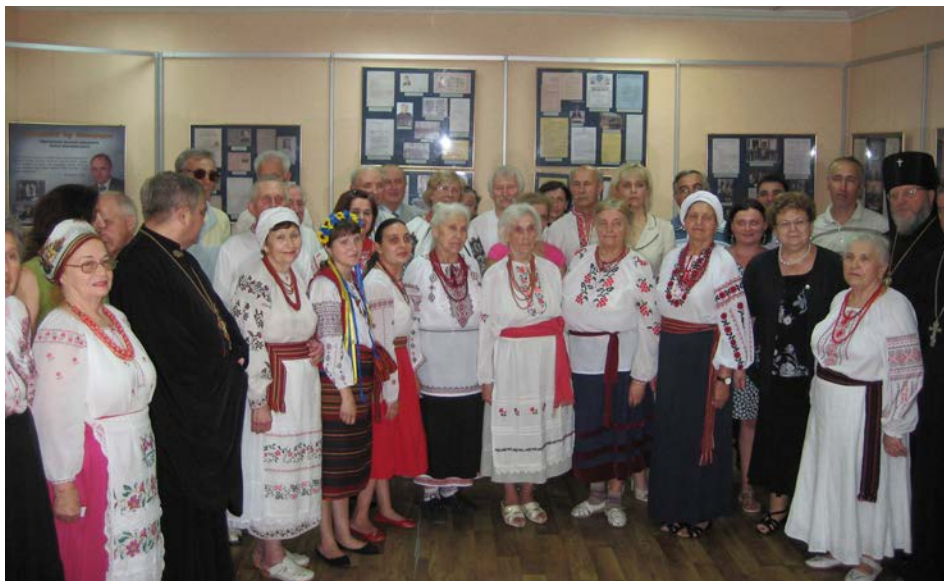
Спільне фото учасників заходу.