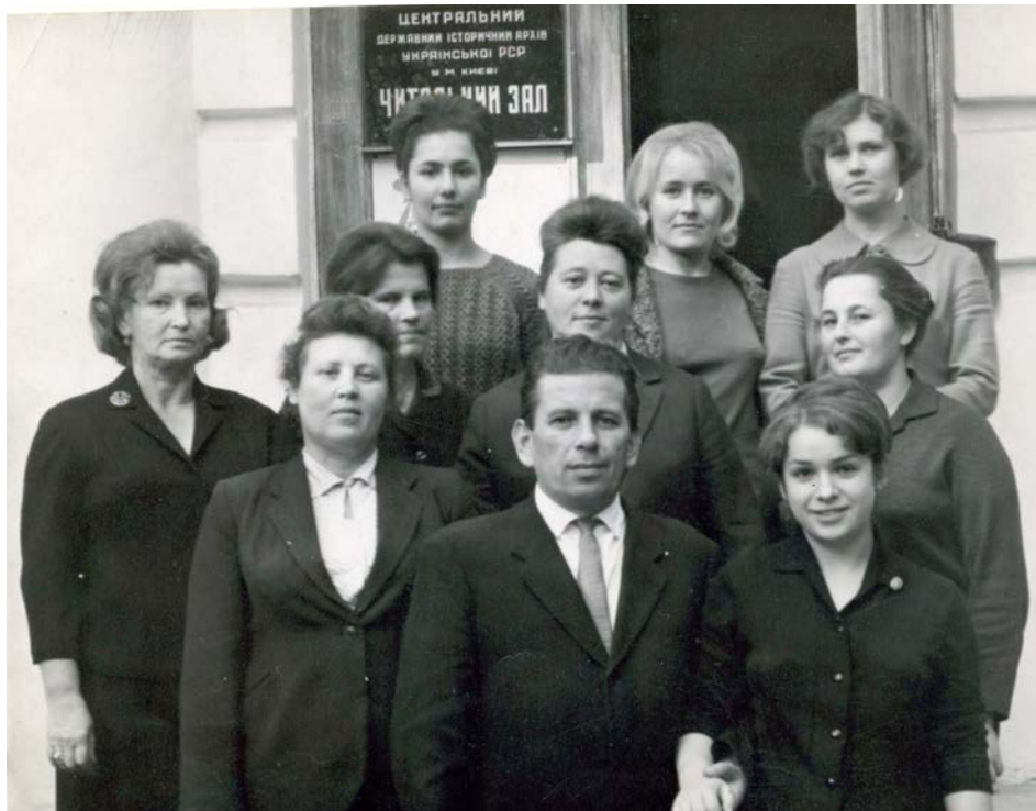
Перший колектив ЦДАМЛМ України. [1967].