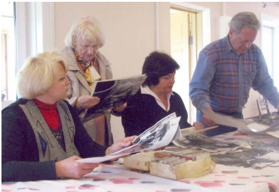
Співробітники відділу “Літературно-мистецькі Плоти” ЦДАМЛМ України під час роботи. 2010-і рр.

архіву. Відведена площа використана максимально, кабінет директора фактично перетворився у музейно-бібліотечне сховище, де для відвідувачів вміщується ледве один стілець. З 1968 року в архіві-музеї мають працювати 16 осіб, вже зараз працюють 13” 16 .