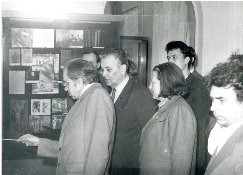
Директор ЦДАМЛМ України М. І. Крячок знайомить гостей з експозицією архіву-музею. У складі групи – Олесь Гончар із дружиною Валентиною. Кін. 1970-х. З фонду ЦДАМЛМ України (ф. 673).

і немає ніякої гарантії, що вони будуть збережені. Багато з них знаходяться за межами УРСР і навіть за межами Радянського Союзу. Ніхто по-справжньому не займається збиранням та зберіганням цих документів. Саме ці обставини зумовлюють невідкладну потребу створення в Україні Центрального державного архіву літератури і мистецтва.