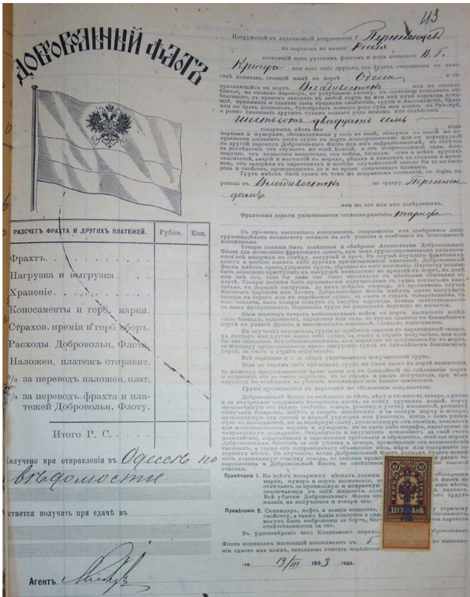
Рахунок одеської торгової фірми "Гульє-Бланшард" на постачання переселенцям сільськогосподарського знаряддя. Держархів Одеської обл., ф. 2, оп. 3, спр. 2353, арк. 113.