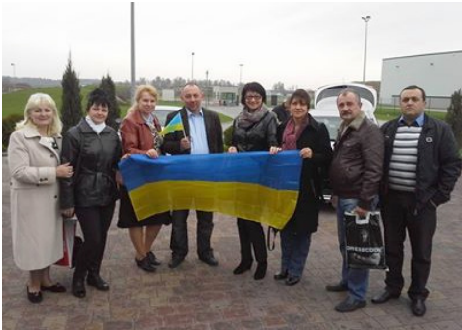
Делегація українських архівістів і освітян. м. Пьотркув Трибунальський (Польща), 2014 р.

ркува Трибунальського, доктор Томаш Матушак прочитав архівістам Держархіву Миколаївської області лекцію з історії та сучасних напрямів роботи державних архівів Республіки Польща, приділивши особливу увагу історії Державного архіву Пьотркува Трибунальського.