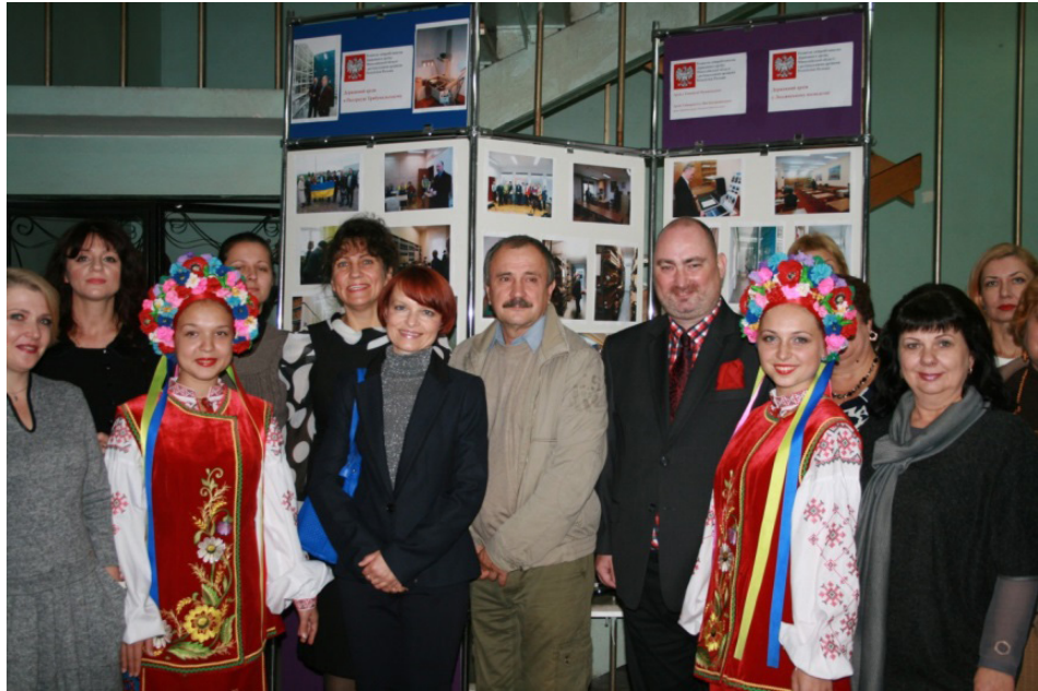
Зустріч польських і українських архівістів у Державному архіві Миколаївської області, 2016 р.