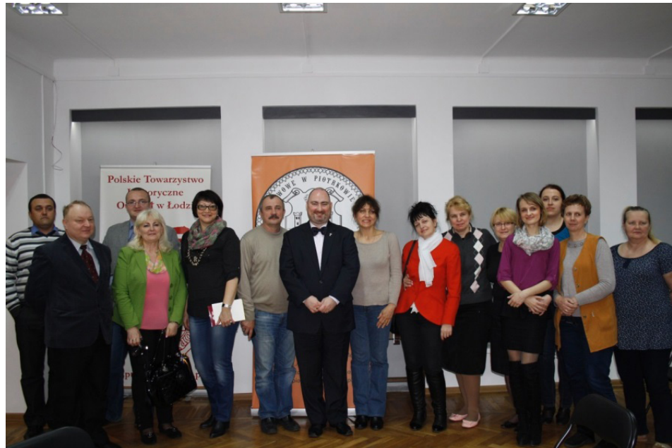
Зустріч українських і польських архівістів у філії Державного архіву Пьотркува Трибунальського в Томашуві Мазовецькому, 2014 р.