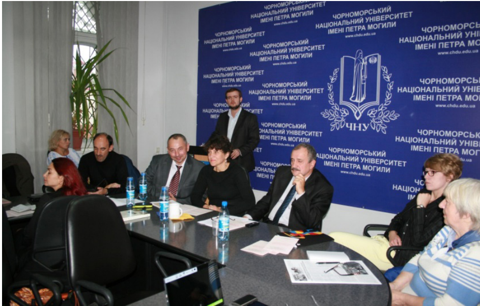
Під час роботи конференції “Архіви на службі суспільства та громадян” у Чорноморському національному університеті імені Петра Могили, м. Миколаїв, 2016 р.

мости про школи, будівництво нових навчальних закладів, ліквідацію неписьменності, відкриття клубів; документи установ і організацій релігійного культу: римсько-католицького, православного, протестантського культур, у т. ч. Пьотркувського приходу Всіх Святих; документи установ охорони здоров'я, які висвітлюють організацію медичної допомоги населенню, зростання кількості медичних установ, проведення загальносанітарних профілактичних заходів, боротьбу з інфекційними захворюваннями; фонди особового походження і колекції документів, які характеризують службову та громадську діяльність представників пьотркувської інтелектуальної еліти, у т. ч. польського історика і краєзнавця Михайла Равіти-Вітановського; історика, палеографа, нумізмата, сенатора Царства Польського Казимира Стрончінського тощо.