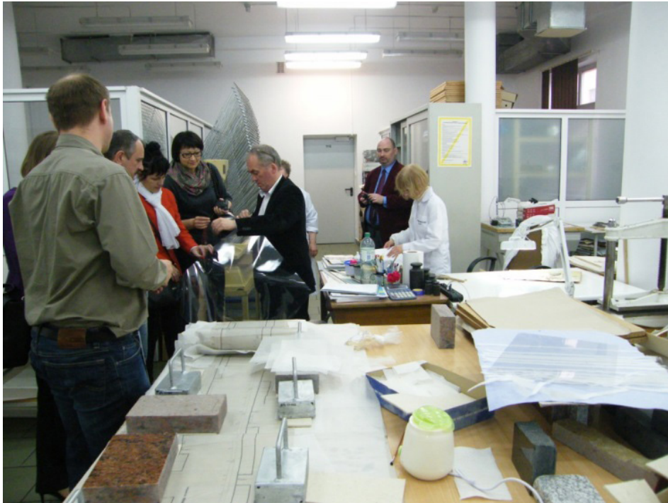
Ознайомлення українських архівістів із роботою лабораторії реставрації документів у Державному архіві Лодзя, 2014 р.

документів архіву, зробити необхідну заявку, замовити копію. Правила складання описів у польських архівах відповідають Міжнародному стандарту архівного описування, розробленому Комітетом стандартизації описування в Стокгольмі 1999 р.;