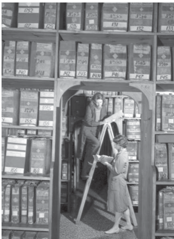
Завідувачка відділу публікацій