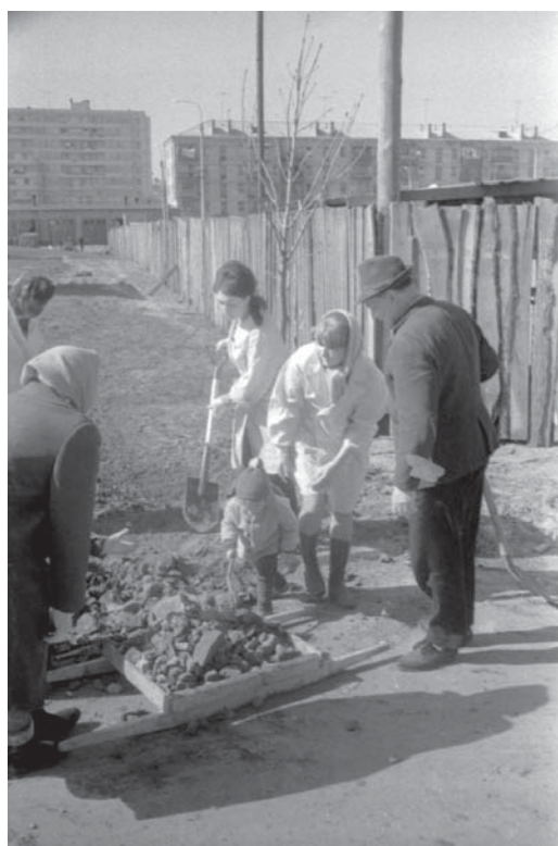
Співробітники ЦДАКФФД УРСР під час суботника.

ЦДКФФА України ім. Г. С. Пшеничного. Од. обл. 0-090510.