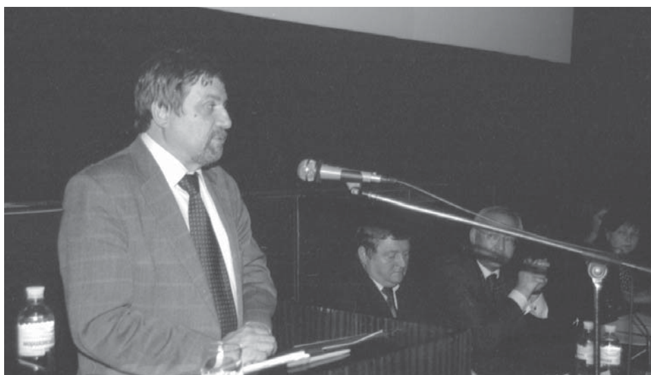
Голова Національної спілки кінематографістів України С. В. Тримбач виступає під час міжвідомчої розширеної наради з питань дотримання чинного законодавства щодо поповнення Національного архівного фонду аудіовізуальними документами та забезпечення їх збереженості.

ЦДКФФА України ім. Г. С. Пшеничного. Од. обл П-10845.