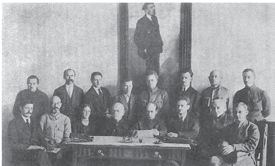
Перша нарада архівних працівників УСРР. Харків, 6–10 грудня 1924 р. ЦДКФФА України ім. Г. С. Пшеничного. Од. обл. 0-058321.