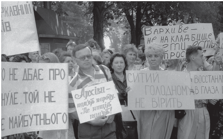
Пікети працівників центральних архівних установ України перед будинком Ради Міністрів України з вимогою виплати заборгованості із заробітної платні.