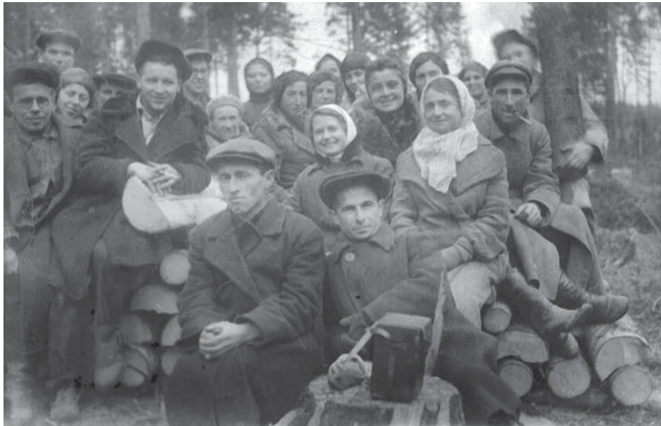
Співробітники архівів Києва і Харкова на лісозаготівлях під час евакуації в м. Златоусті (РРФСР). 1942 р. ЦДКФФА України ім. Г. С. Пшеничного. Од. обл. 0-58365.