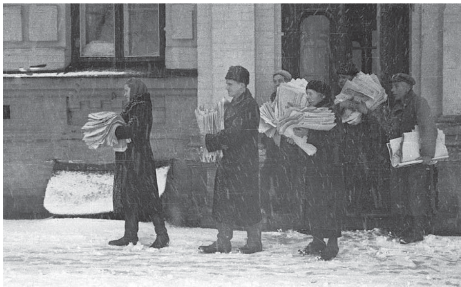
Співробітники УДА НКВС УРСР збирають документи в перші дні звільнення м. Києва від нацистських військ. Листопад, 1943 р. ЦДКФФА України ім. Г. С. Пшеничного. Од. обл. 0-000298.