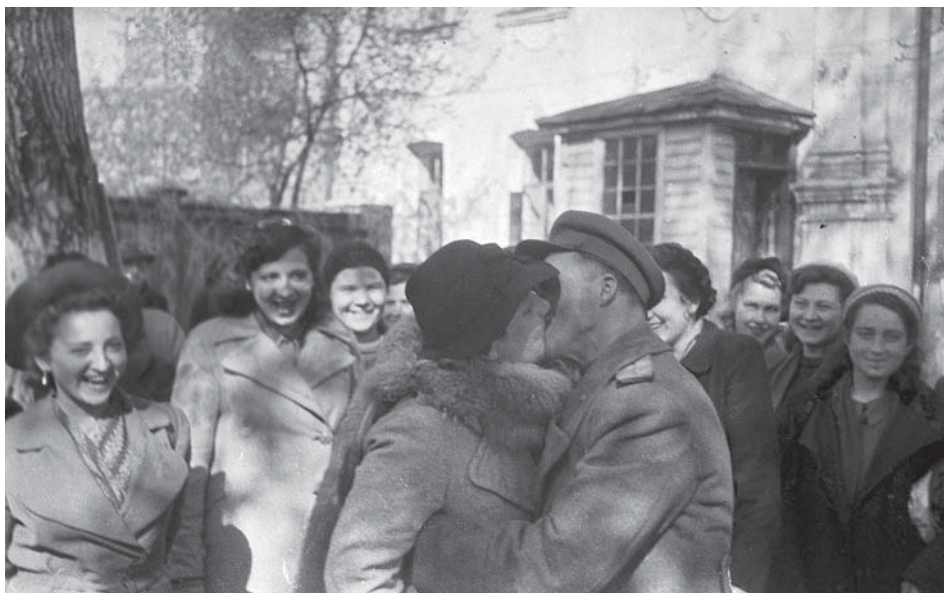
Співробітники УДА НКВС УРСР і центральних архівів НКВС УРСР святкують День Перемоги. м. Київ, 9 травня 1945 р. ЦДКФФА України ім. Г. С. Пшеничного. Од. обл. 0-000323.