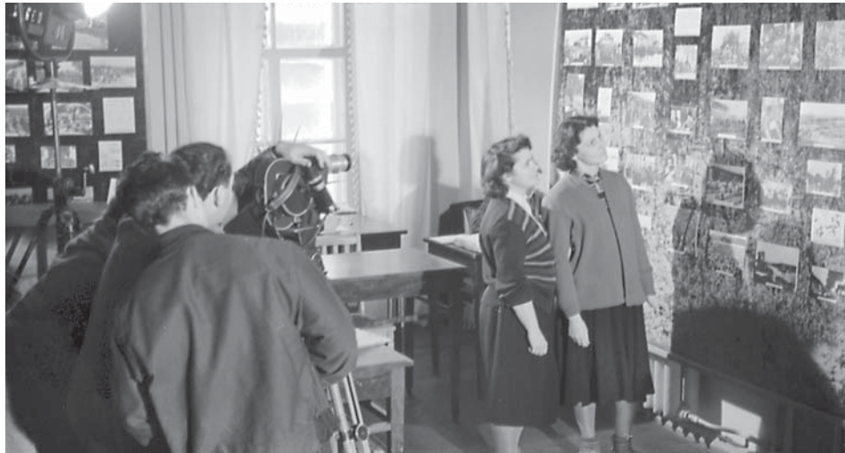
Знімальна група Укркінохроніки проводить зйомку виставки, організованої АУ МВС УРСР і ЦДАКФД УРСР з нагоди 40-річчя Жовтневої революції. м. Київ, січень 1958 р. Од. обл. 0-56969.