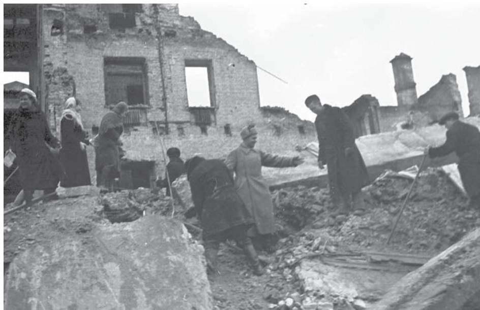
Співробітники УДА НКВС УРСР розбирають руїни на вул. Хрещатик у м. Києві. 12 березня 1944 р. ЦДКФФА України ім. Г. С. Пшеничного. Од. обл. 0-000186.