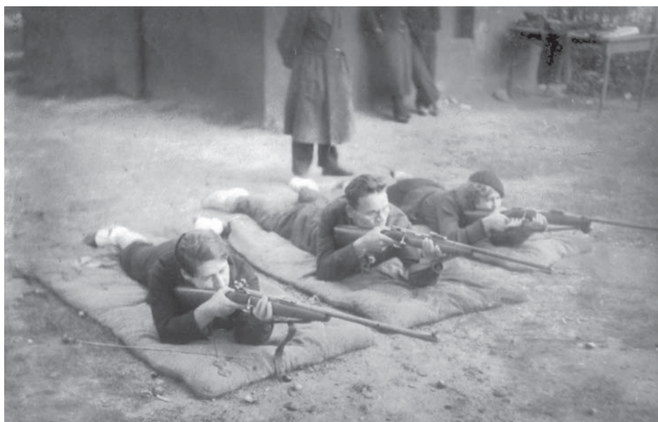
Співробітники Київського обласного історичного архіву здають норми на значок “Ворошилівський стрілець”. м. Київ, 1936 р. Од. обл. 0-058241.