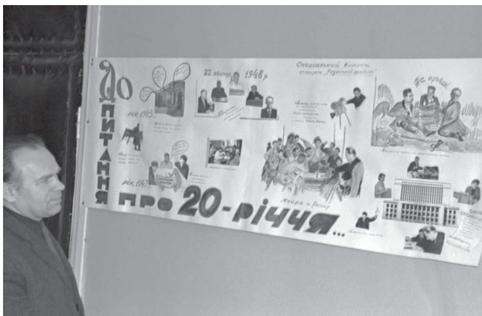
Спеціальний випуск стінгазети АУ при Раді Міністрів УРСР, присвячений 20-річчю журналу "Архіви України". м. Київ, 1967 р.

ЦДКФФА України ім. Г. С. Пшеничного. Од. обл. 0-090510.