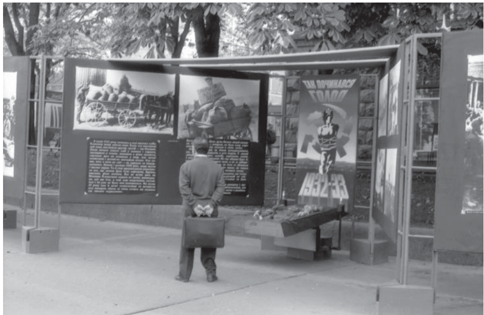
Фотовиставка “Голодомор: хроніка і факти” на вул. Хрещатик. м. Київ, вересень 1993 р.

ЦДКФФА України ім. Г. С. Пиленого. Од. обл 0-185728.