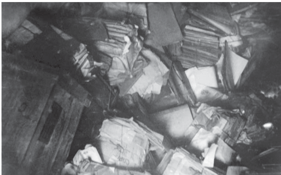
Документи одного із зруйнованих і пограбованих архівів УРСР. Україна, 1943–1944 рр. Од. обл. 0-194774.