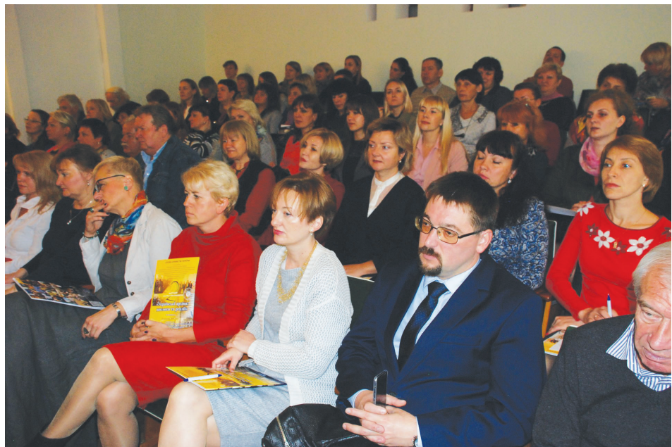
Учасники круглого столу у конференц-залі Центрального державного архіву-музею літератури і мистецтва України.