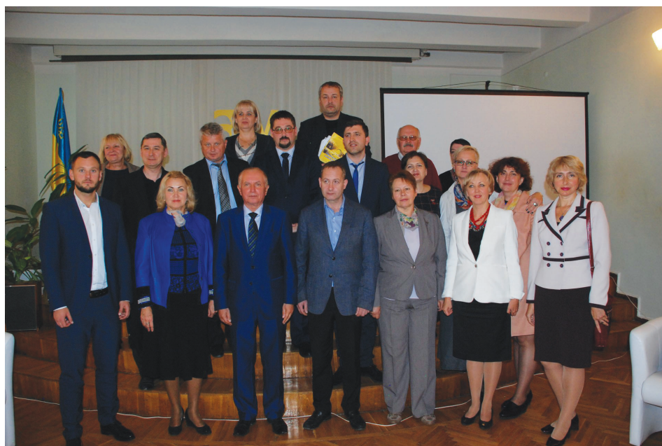
Організатори і учасники круглого столу.