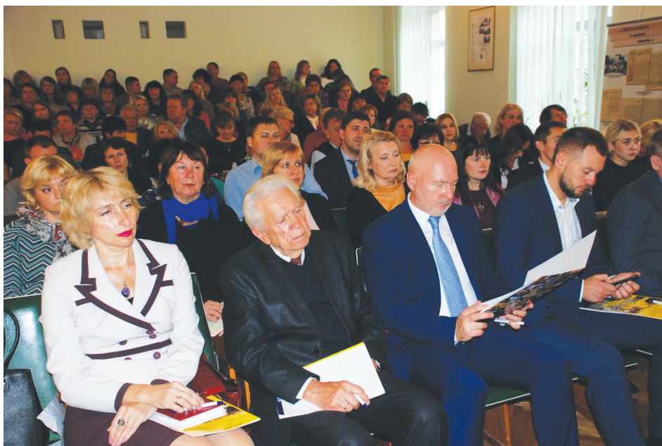
У роботі круглого столу взяли участь відповідальні працівники Державної архівної служби України, архівних установ, науковці, представники громадськості.