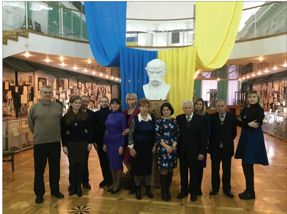
Учасники джерелознавчих читань у Музей історії Київського національного університету імені Тараса Шевченка.

У виступах доповідачів та у ході дискусій було окреслено низку нагальних питань щодо методології історичних та історіографічних