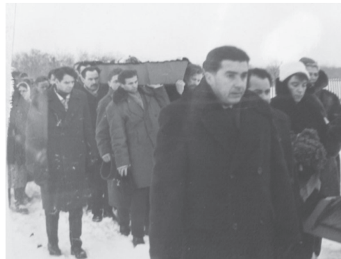
Є. О. Сверстюк із друзями-однодумцями несе труну В. А. Симоненка. Черкаси, грудень 1963 р.