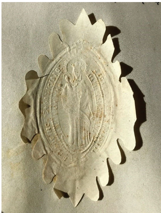
Відбиток печатки Галицької провінції бернардинців. Відділ рукописів ЛННБ України імені Василя Стефаника. Ф. 5. Оп. 3. Од. зб. 2292. Арк. 1. Оригінал.