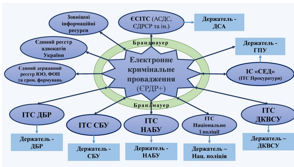
Рис. 4. Схема інтеграції ІТС ОДР до єдиного електронного інформаційного поля органів кримінальної юстиції

Реалізація окреслених вище етапів дасть змогу забезпечити послідовне проектування й запровадження ІТС ОДР, належну апробацію її функціоналу та врахувати інтереси користувачів.