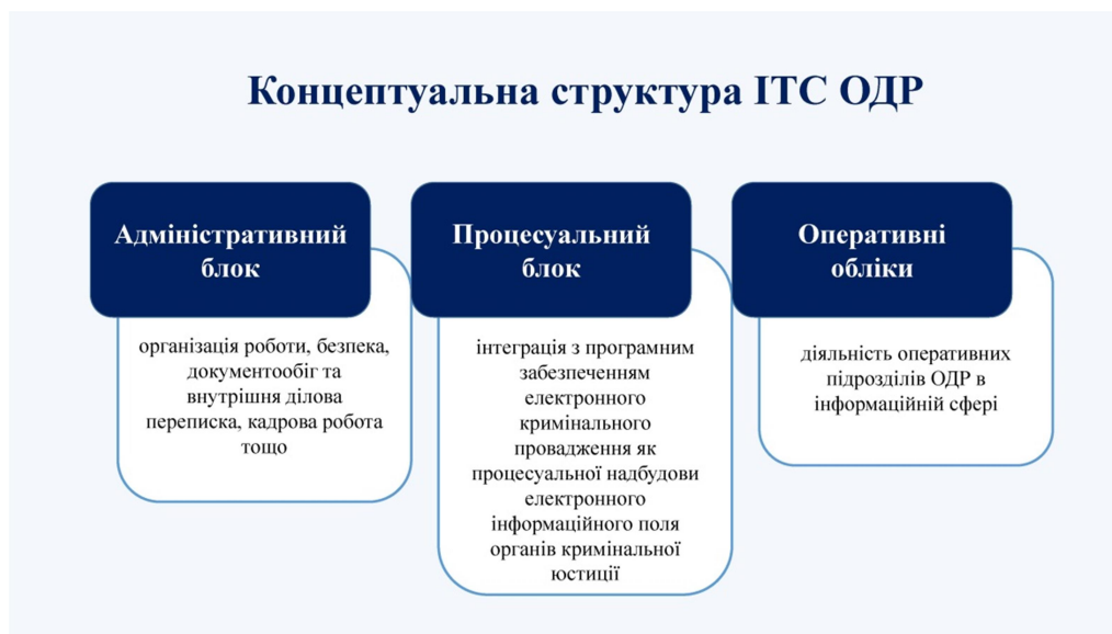
Рис. 1. Концептуальна структура ІТС ОДР

Перший етап – створення нормативної бази – передбачає здійснення заходів з розроблення та затвердження низки документів: Технічного завдання на розробку програмного забезпечення ІТС ОДР; Технічного завдання для серверної системи апаратної частини ІТС ОДР (аналітична); Технічного завдання для комплексної системи захисту інформації ІТС ОДР; Специфікації (технічні вимоги) до ІТС ОДР; Положення про порядок ведення ІТС ОДР; Правил розмежування прав доступу до ресурсів ІТС ОДР (затверджених керівником ОДР); Положення про обмін даними між ІТС ОДР та ЄРДР (затвердженого керівником ОДР і Генеральним прокурором) тощо.