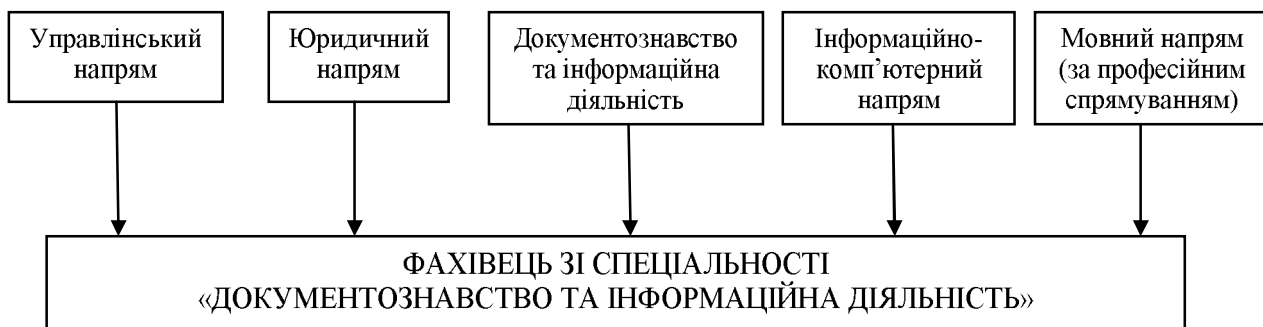
Рисунок 1. Структурно-тематичні навчальні напрями дисциплін спеціальності «Документознавство та інформаційна діяльність»

Системний підхід до підготовки фахівців з документознавства та інформаційної діяльності виділяє п'ять структурно-тематичних навчальних напрямів дисциплін, а саме: документознавства та інформаційної діяльності, інформаційно-комп'ютерний, управлінський, юридичний та мовний (рис. 1).