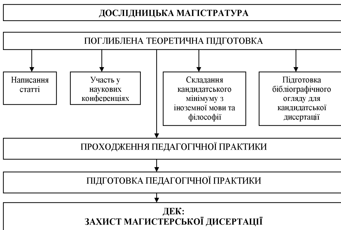
Рисунок 3. Структурно-логічна схема підготовки студентів в дослідницькій магістратурі за спеціальністю «Документознавство та інформаційна діяльність»

Місцями роботи випускників дослідницької магістратури за спеціальністю «Документознавство та інформаційна діяльність» можуть бути: вищі навчальні заклади, науково-дослідницькі інститути, аналітично-інформаційні центри. Наприклад, з метою підвищення якості освіти на кафедрі документознавства та інформаційної діяльності Одеського національного політехнічного університету (ОНПУ) магістрантами періодично здійснюються самостійні аналітичні дослідження з низки проблем, а саме: підготовки спеціалістів документно-інформаційної сфери в ОНПУ з точки зору студентів; стану освітньої інфраструктури та ринку праці документно-аналітичної професії (зокрема, моніторинг наявних вакансій, резюме та вимог до працівника цієї галузі), що дає можливість не лише отримати зворотний зв'язок, але й «тримати руку на пульсі сучасного про-