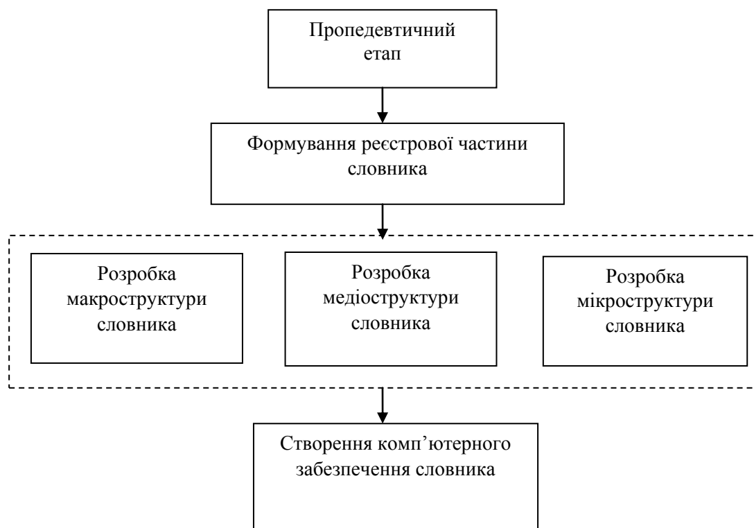
Рисунок 1. Блок-схема алгоритму створення електронного термінологічного словника (за Є. Купріяновим)

Репрезентуючи роботу над укладанням багатомовного електронного словника гідротурбінних термінів, Є. Купріянов пропонує такий алгоритм створення електронного термінологічного словника: 1) пропедевтичний етап (аналіз існуючих спеціалізованих комп'ютерних словників з метою виділення в цих словниках лексикографічних параметрів та шляхи їх доповнення або уточнення); 2) формування реєстрової частини словника; 3) розроблення макроструктури, медіоструктури та мікроструктури словника (за Е. Агриколою, макроструктура – це організація словника в цілому, мікроструктура – це окрема словникова стаття, а медіоструктура – взаємозв'язки між цими статтями [1]); 4) створення комп'ютерного забезпечення словника [11].