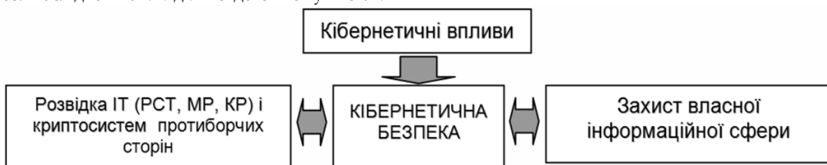
Рис. 1. Складові кібернетичної безпеки

Такий стан справ дає підстави стверджувати, що відсутність надійної системи кібернетичної безпеки ( стан захищеності кіберпростору в цілому або окремих об'єктів його інфраструктури та засобів їх взаємодії від ризику стороннього кібернетичного впливу ) може призвести до втрати політичної незалежності будь-якої держави світу, тобто до фактичного програву нею війни невійськовими засобами та підпорядкування її національних інтересів інтересам іншої (протиборчої) сторони (рис. 1) [1, 2].