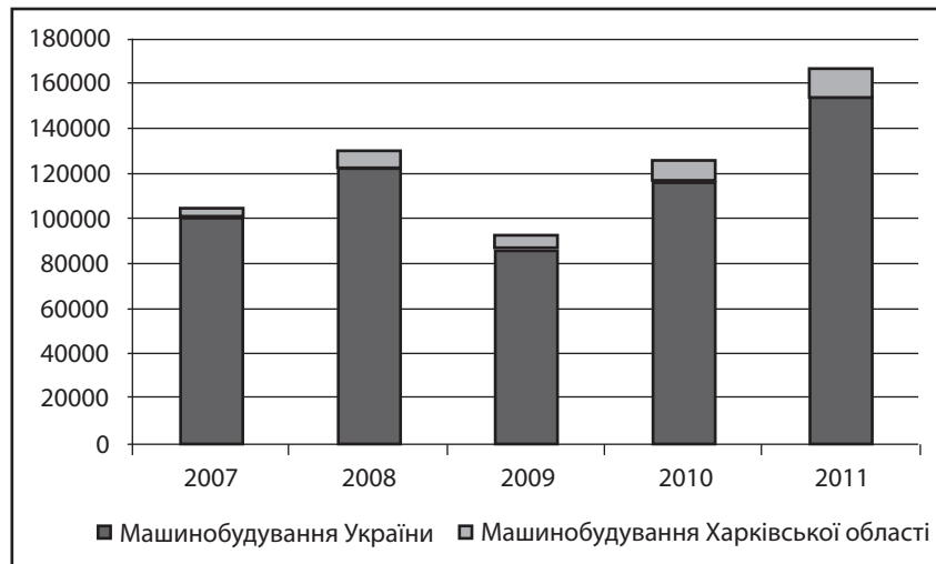
Рис. 2. Обсяги реалізованої продукції машинобудівного комплексу у 2007 – 2011 рр. в Україні та в Харківській області

зованої промислової продукції, що свідчить як про збільшення обсягів виробництва, так і про попит на вітчизняну продукцію машинобудівного комплексу. Проте, є ряд чинників, що стримують розвиток машинобудівного комплексу Харківської області. Серед них можна назвати: нестачу оборотних коштів, цінові коливання на світовому ринку, застаріле обладнання, високу конкуренцію з боку зарубіжних аналогічних товарів, надто високі тарифи природних монополій. Вирішення цих про-