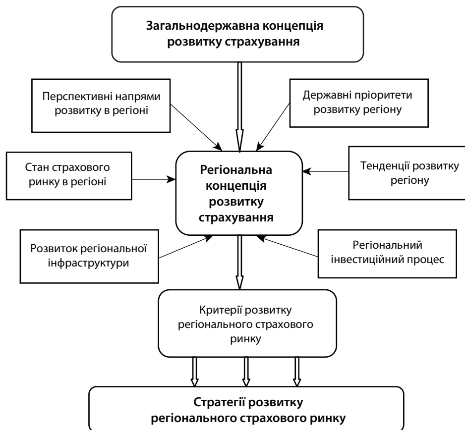
Рис. 4. Чинники розвитку страхового ринку в регіоні