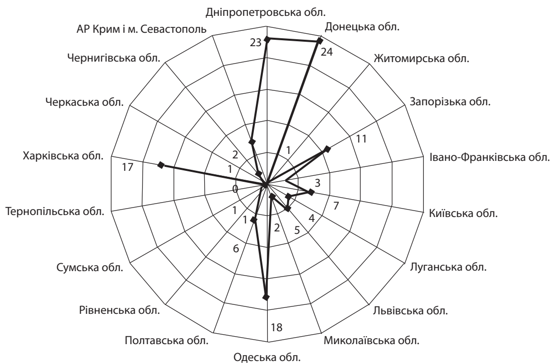
Рис. 1. Кількість зареєстрованих страхових компаній по регіонах України на 2010 р.