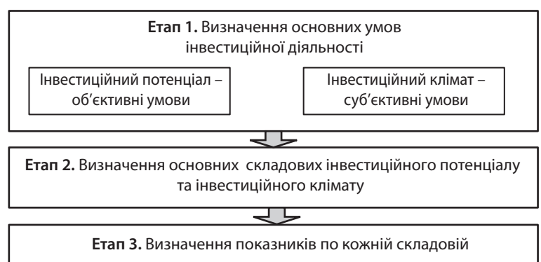
Рис. 1. Методика формування простору чинників інвестиційної діяльності

Інвестиційний клімат – це середовище, в якому перебігають інвестиційні процеси. Він формується під впливом взаємозв'язаного комплексу законодавчо-нормативних, організаційно-економічних, соціально-полі-