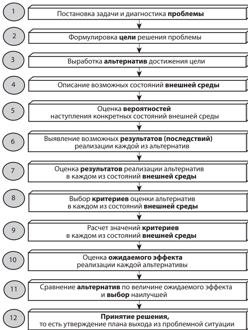
Рис. 1. Этапы принятия решений