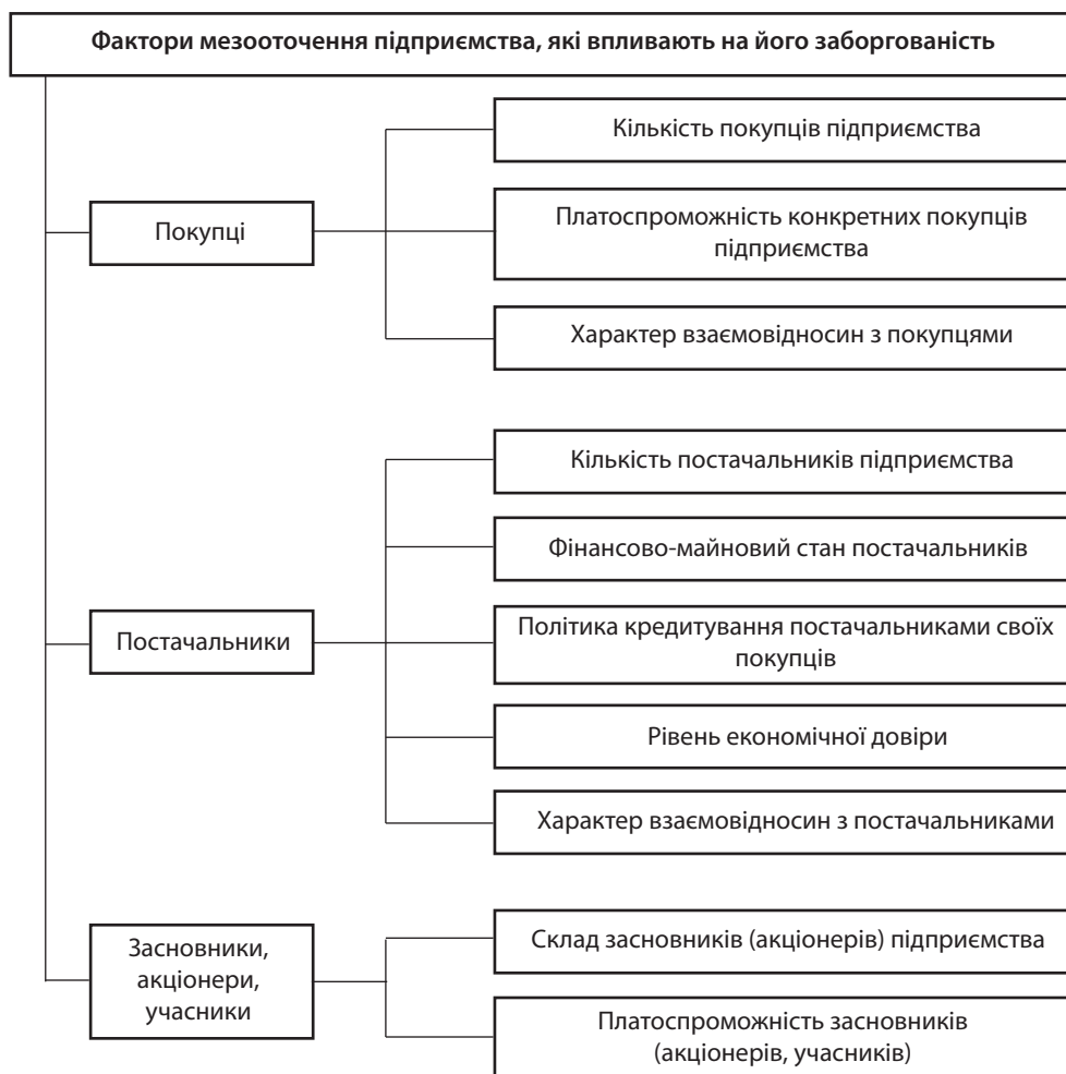
Рис. 2. Класифікація факторів мезооточення, які впливають на заборгованість підприємства