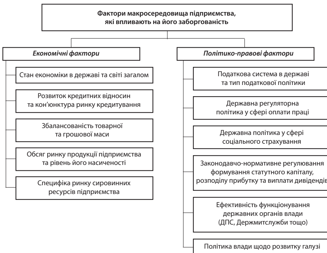
Рис. 1. Класифікація факторів макросередовища, які впливають на заборгованість підприємства