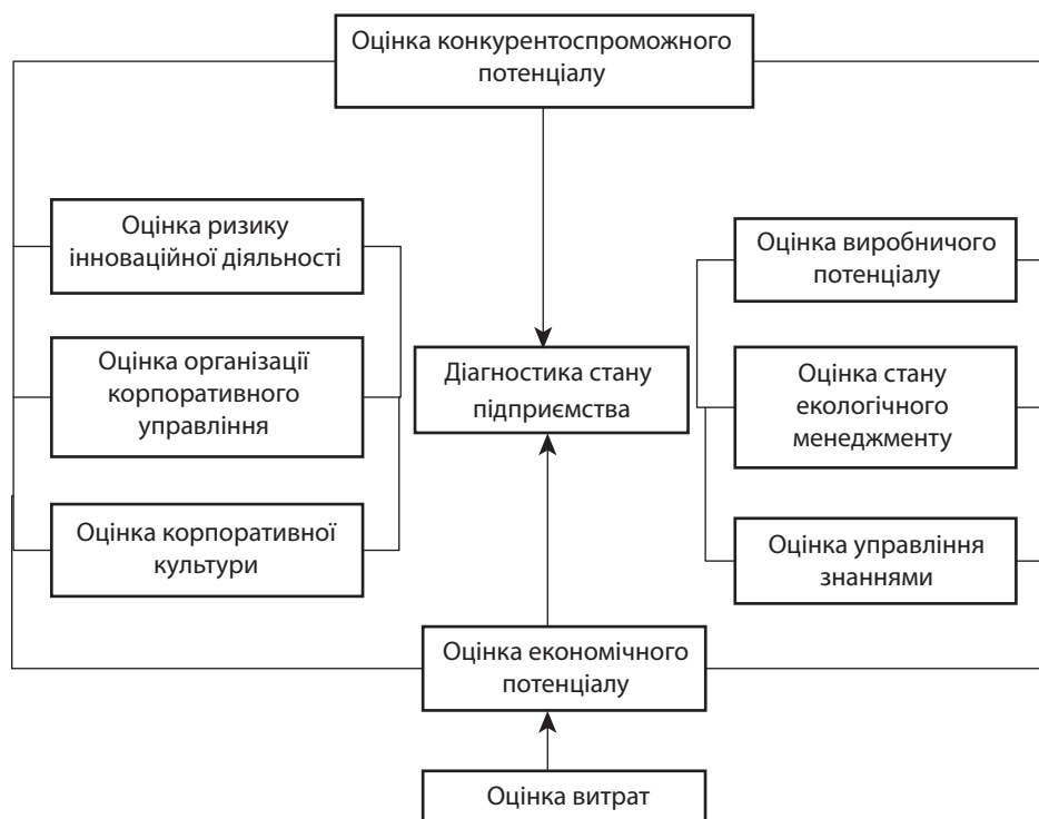
Рис. 3. Сфери діагностики стану підприємства

Сприятим підвищенню ефективності управління конкурентним потенціалом може створення моделі, яка складається з трьох блоків: перший – конкурентний аналіз, який поєднує в собі внутрішнє середовище підприємства, зовнішнє середовище підприємства, внутрішні конкурентні можливості та можливості конкурентного оточення; другий – формування конкурентного потенціалу, який здійснюється шляхом порівняння сильних сторін конкурентної позиції підприємства та конкурентів, виявленням ключових чинників успіху, які забезпечують конкурентну раціональність підприємства та стійкі конкурентні переваги, визначення конкурентного потенціалу, виявлення слабких сторін конкурентної позиції підприємства та конкурентного ризику; третій – управління конкурентним потенціалом, мета якого – використання мінімально необхідної кількості ресурсів для досягнення максимального результату в потрібний час, у потрібному місці, планування використання потенціалу відповідно до вибраної стратегії