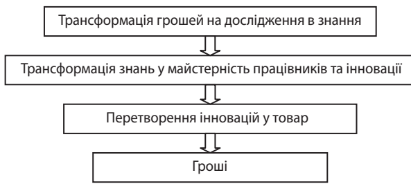
Рис. 2. Відтворювальний процес інноваційної моделі економіки