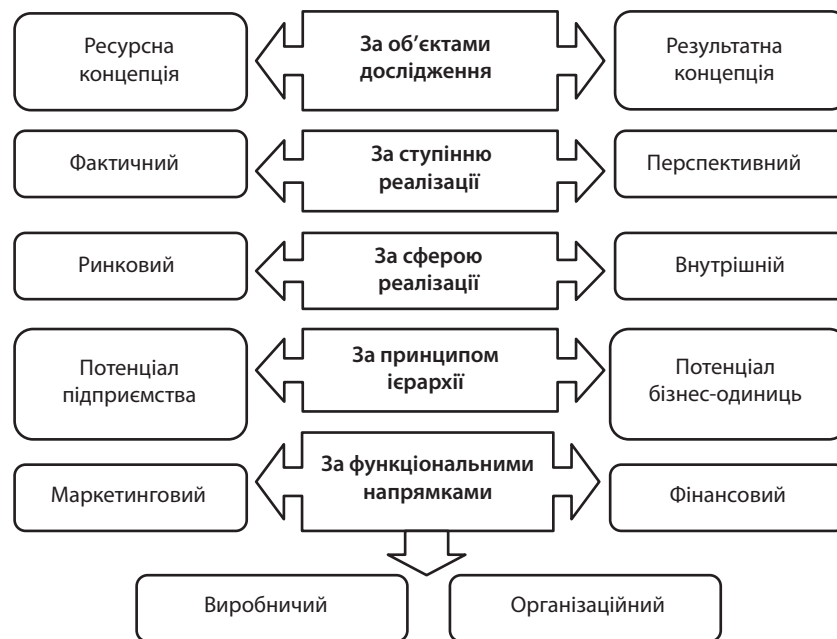
Рис. 1. Класифікація видових проявів потенціалу підприємства

Фактичний і перспективний потенціал різні автори класифікують за різними ознаками. Наприклад, Краснокутська Н. С. [2, с. 9] виділяє за ступенем реалізації, а Федонін О. С., Репіна І. М. та Олексюк О. І. за мірою реалізації потенціалу [9].