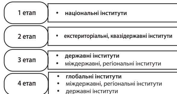
Рис. 1. Етапи розвитку зовнішньоекономічних інститутів Складено автором.

Можна виділити етапи в зміні моделей зовнішньоекономічних інститутів на основі об'єктивно-історичної логіки перетворень (рис. 1) і провести їх порівняльний аналіз. На початкових етапах інститути зовнішньоекономічної діяльності детермінувалися значною мірою лише національними інтересами і визначали зміст наддержавних, міждержавних утворень. На четвертому етапі пріоритетними детермінантами із розвитку стали глобальні інститути, які обумовлюють зміни національної складової зовнішньоекономічних інститутів.