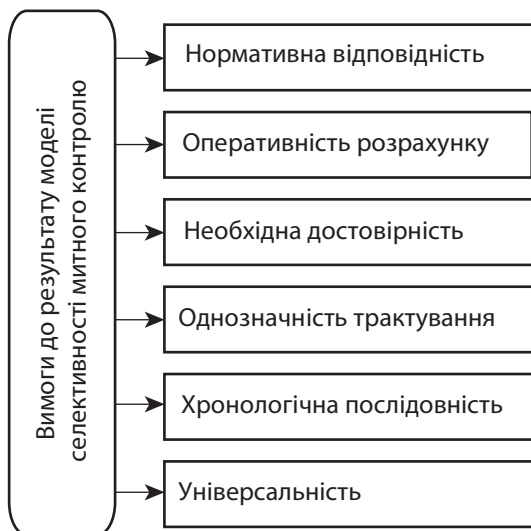
Рис. 2. Вимоги до результату моделі селективності митного контролю з урахуванням основних параметрів ризикованості переміщення товарів через митний кордон

чинному нормативному забезпеченню. Також, враховуючи часові вимоги на проведення митного контролю, процес отримання результату повинен бути оперативним з належною достовірністю. Однозначність трактування отриманого результату буде забезпечувати мінімізацію впливу «людського фактора» при прийнятті рішень посадовими особами. Хронологічна послідовність виконання операцій буде дозволяти реалізовувати процес митного контролю без надмірних зусиль і з можливістю перевірки отриманих результатів, причому отриманий результат повинен бути певною мірою універсальним щодо інтерпретації незалежно від способу переміщення товару через митний кордон. Таким чином, вимоги до результату моделі відповідним чином позначається і на процесах її використання (рис. 3).