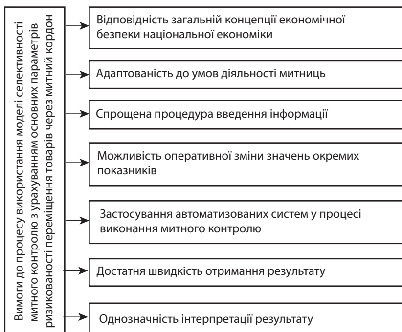
Рис. 3. Вимоги до процесу використання моделі селективності митного контролю з урахуванням основних параметрів ризикованості переміщення товарів через митний кордон

Наведені на рис. 3 вимоги до процесу використання моделі у повному обсязі відповідають можливостям митниць Міндоходів, оскільки вдосконалення інформаційної взаємодії суб'єктів ЗЕД і митниць є одним з пріоритетів розвитку новоствореного міністерства. Гнучкість адаптації та зміни основних показників моделі, відповідно до специфічних умов і ризиків притаманних процесу митного контролю у конкретних митницях Міндоходів, забезпечують відповідність вимогам формування дієвої системи захисту економічних інтересів держави.