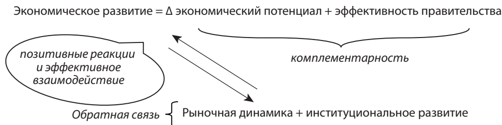
Рис. 1. Механизм взаимодействия экономического и институционального развития

Институциональное развитие является результатом институциональных изменений. Учеными доказано, что хорошо развитые институты власти снижают неопределенность и расходы асимметрии информации, финансовой асимметрии, а также противодействуют проявлениям оппортунистического поведения государственных и корпоративных структур, групп особых интересов из кругов чиновников и бизнес-лидеров [8, р. 1 – 31]. Институты власти, которые вызывают доверие у экономических агентов разных уровней и граждан государства, способствуют становлению среды, – институциональной, рыночной, инновационной, – которая повышает эффективность распределения ресурсов экономической системы и системы перераспределения доходов. Однако положительные реакции на действия институтов власти вызывают институциональные изменения, проявляющиеся в стране медленно, поскольку институциональное развитие имеет высокую степень зависимости от институтов прошлого ( path dependence ) [7, с. 114 – 115, 123]. Медленная изменчивость институтов власти в сторону усовершенствования и минимизации деструк-