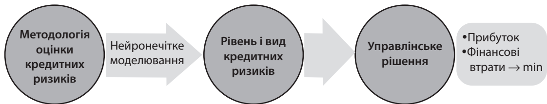
Рис. 3. Вплив ННМ на фінансовий результат банку

2. Оскільки банки функціонують в різних ринкових умовах і їх структура є різною, то й управління кредитними ризиками здійснюється по-різному. Проте всі системи ризик-менеджменту мають і спільні риси, а ефективність управління значною мірою залежить від належного інформаційного базису при прийнятті рішень менеджерами банку.