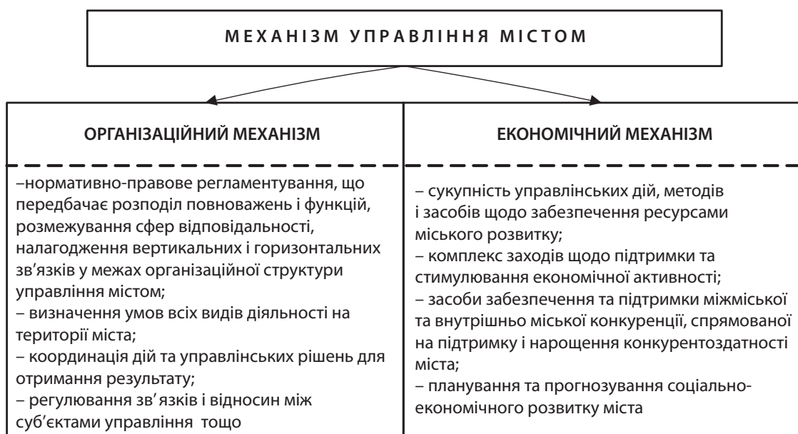
Рис. 5. Складові елементи механізму управління містом