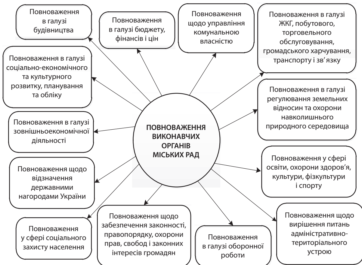
Рис. 2. Основні галузеві повноваження виконавчих органів міських рад

До повноважень соціально-економічного розвитку виконавчих органів міських рад слід віднести такі: