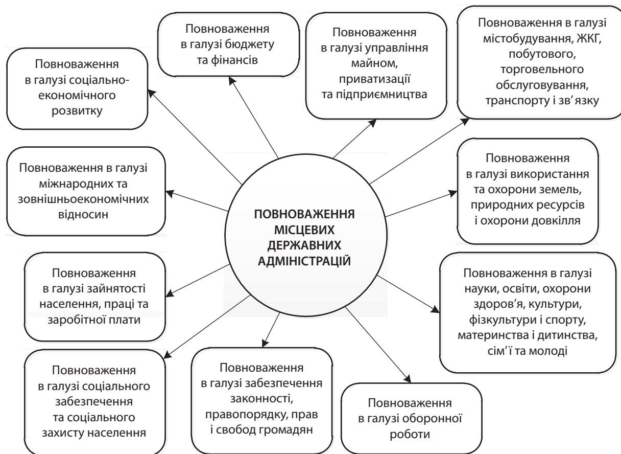
Рис. 1. Основні галузеві повноваження місцевих державних адміністрацій

Повноваження виконавчих органів міських рад можуть бути розподілені за сферами життєдіяльності, що представлено на рис. 2.