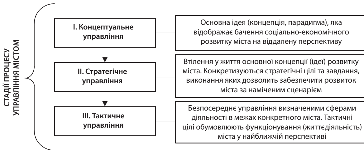
Рис. 3. Основні стадії процесу управління містом

ної відповідальності. Непоодинокими є випадки, коли чиновники різних рангів (зокрема у великих містах) надають послуги громадянам за додаткову платню, непередбачену законодавством України. Також не можуть задовольняти мешканців міст великі черги в органах влади, закладах охорони здоров'я, комунальних підприємствах, судових органах тощо та високий рівень бюрократизації в цілому [4].