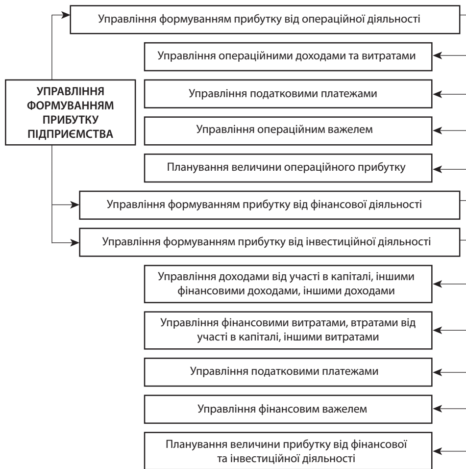
Рис. 2. Структурна схема управління формуванням прибутку підприємства

Формування прибутку підприємства пов'язане зі здійсненням операційної, фінансової та інвестиційної діяльності (рис. 2).