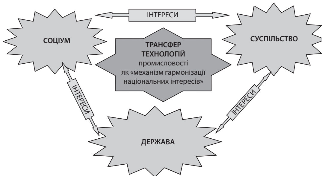
Рис. 2. Трансфер технологій промисловості як механізм гармонізації національних інтересів з позиції часу та простору (розроблено автором)

свою технологічну першість, якщо будуть в змозі освоїти стратегічно правильну модель інноваційного саморозвитку – активне втручання в процес власної зміни, алгоритм «зміни змін», нелінійний, непередбачуваний, що не виражався в звичних показниках процесу» [1].