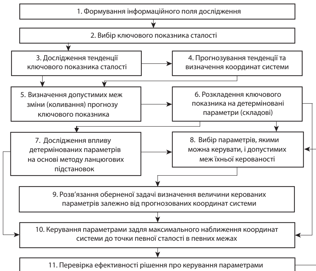
Рис. 2. Алгоритм методу параметричного регулювання сталості динамічних соціально-економічних систем

На рис. 2 зображено загальний алгоритм запропонованого методу, який було апробовано за допомогою даних про діяльність підприємства «Артновабуд» і на основі даних про розвиток промислового виробництва в Україні за 2010 – 2013 рр., що дав змогу вибрати і запропонувати параметри, регулювання яких приведе до більш ефектив-