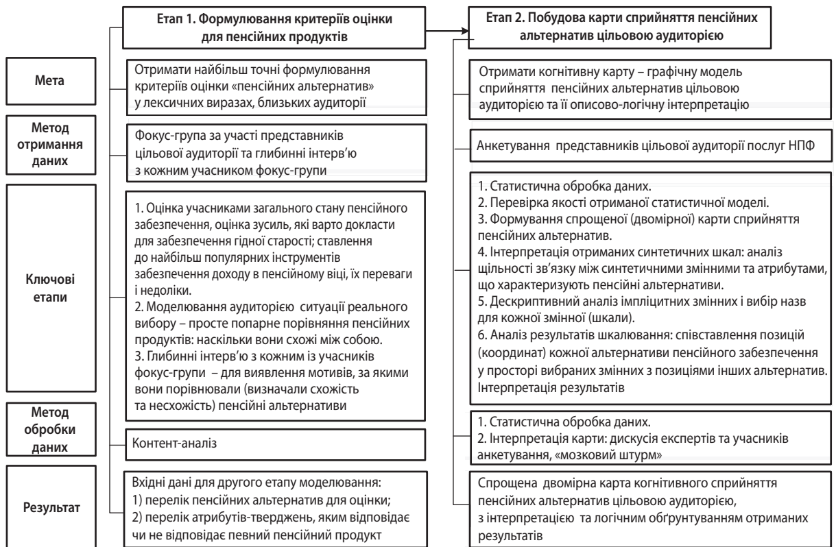
Рис. 1. Компаративний аналіз сприйняття «пенсійних продуктів»: методика дослідження